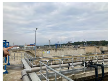
整備された下水道処理施設(ブルサ県オルハンガジ)

時に、地方自治体が運営・維持管理計画を有していることを確認し、建設工事契約の保証期間中にコントラクターが運営・維持管理の技術移転を行うこと、サブプロジェクトにおいて運用・効果指標を設定し、モニタリングすることが事業実施・案件監理上の留意点とされていました。事後評価において、イルバンクや各地方自治体への調査で指標の実績値が確認されたことに加え、下水処理施設等の維持管理職員の技術向上の意見が聞かれ、これら留意点に配慮して実施されていたことが確認されました。