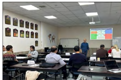
UJCビジネスコースでのグループワークの様子

これらを踏まえ、両フェーズでは自立性強化に向けた取り組みを実施しました。具体的には、プロフェッショナル・マネジメント・プログラム研修で日本人講師の割合を7割から3割に減らし、現地講師を活用しました。さらに、日本での研修では参加者に費用負担を求め、受講料を引き上げることで現地資源を活かした運営体制を整えました。加えて、「カイゼン」や「日本企業の人事事例」など、日本の特色を持つコースを設け、卒業生からはこれらの学びがビジネスに役立っているとの声が寄せられています。