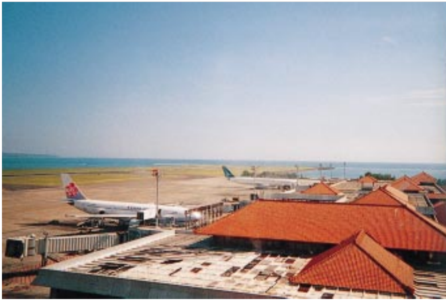
国際線エプロン、ボーディングブリッジおよび滑走路（着陸方向）