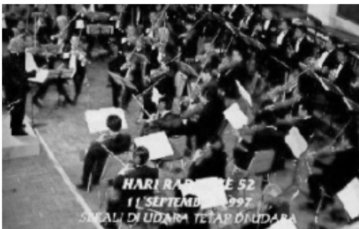
音楽番組、実施機関年報より