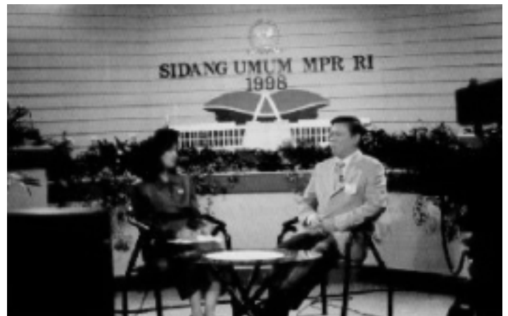
女性のトーク番組、実施機関年報より