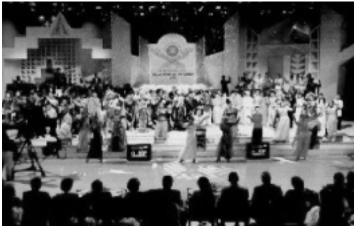
民族芸能番組、実施機関年報より

資機材供給型の事業において、運営・維持管理体制が確立していない場合には、必要性の高い事業であれば、ソフト面での支援等を組み合わせながら運営・維持管理体制を確立していくことも考えられる。その場合、本事業にみられるように、円借款、無償資金協力および技術協力(個別専門家派遣、プロジェクト方式技術協力など)を組み合わせながら、継続的に支援を行っていくことが、重要かつ効果的である。