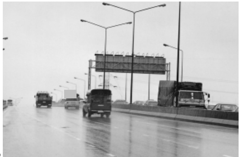
新橋の交通状況 （渋滞しているのは、トンブリよりバンコクに向かう道路）