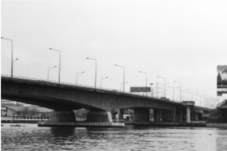
新ラマ6世橋 （完成時点で「ラマ7世橋」と命名された）