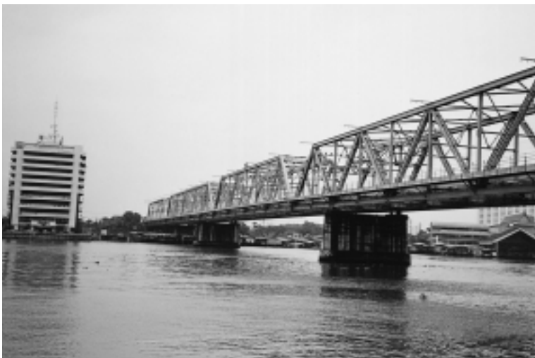
（旧）ラマ6世橋 （現在は、鉄道専用橋として使用されている）