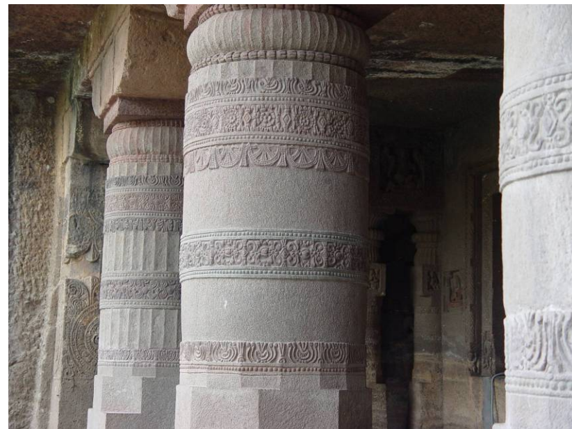
図28 第21石窟の復原ファサード(左)と列柱詳細(右)