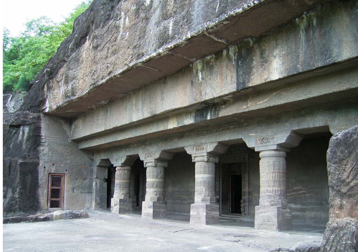
図31 第23石窟の復原ファサード