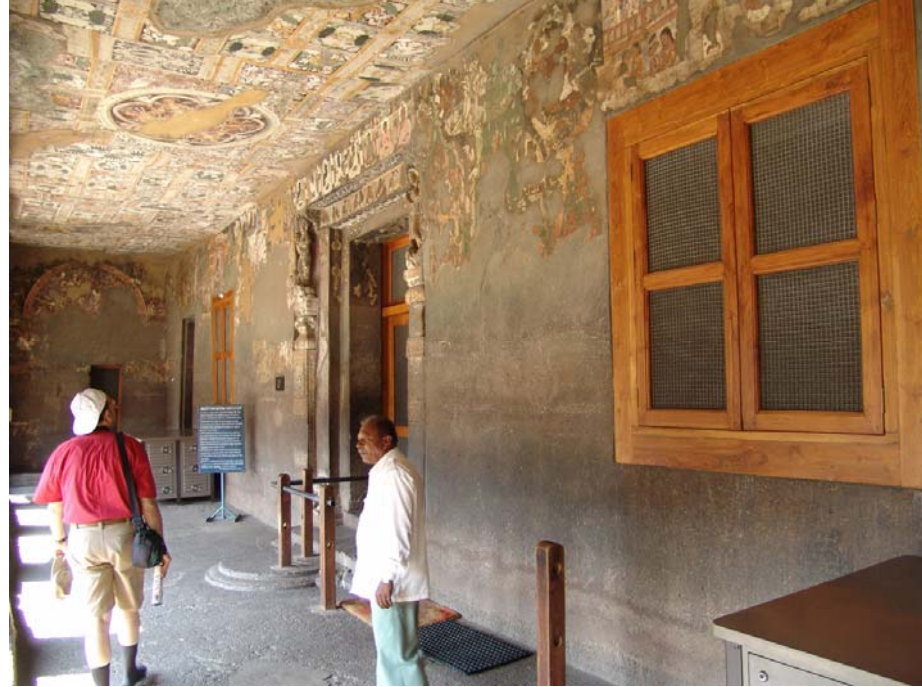
図34 コウモリ防止網戸：第17石窟