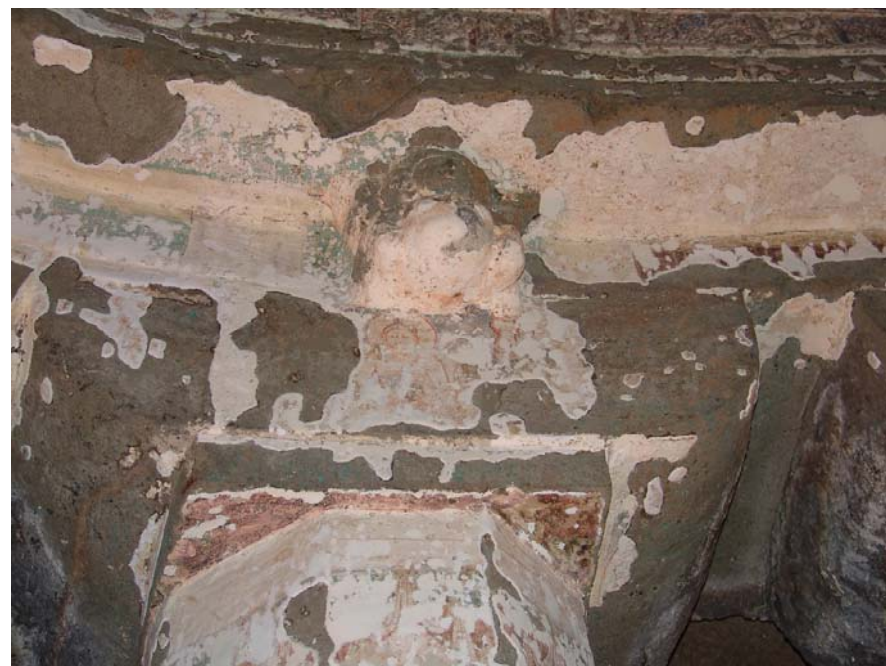
图40 修復後柱頭部分壁画:第26石窟