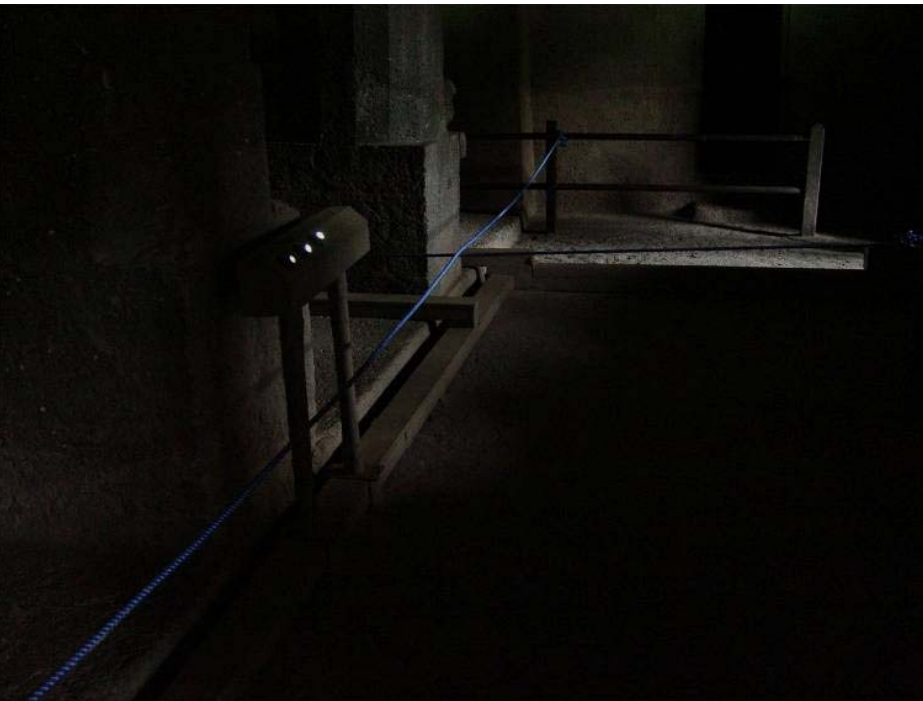
図43 光ファイバー照明システムによる 壁画保存に配慮した公開：第1石窟