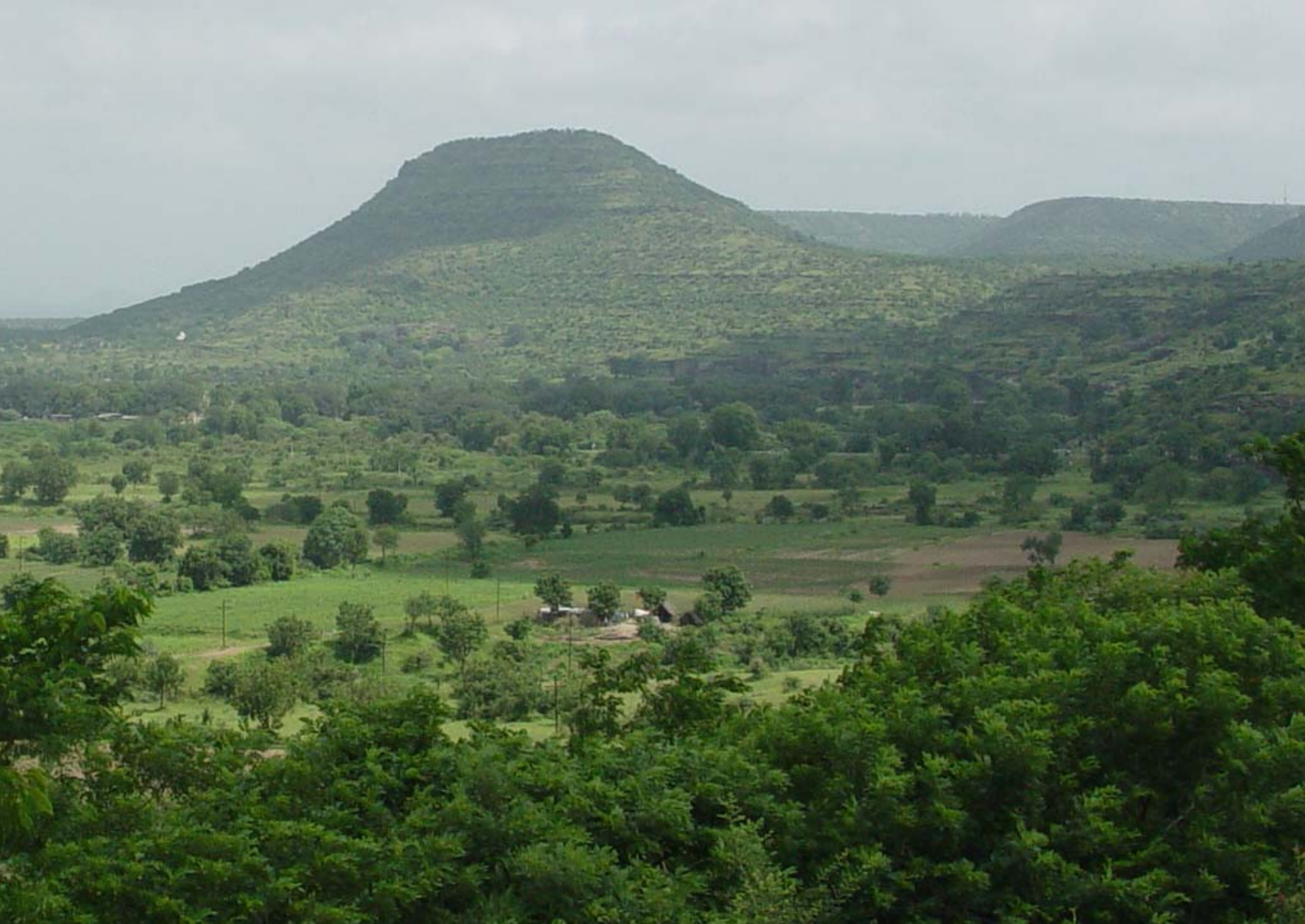
図44 アジャンタ遺跡遠景