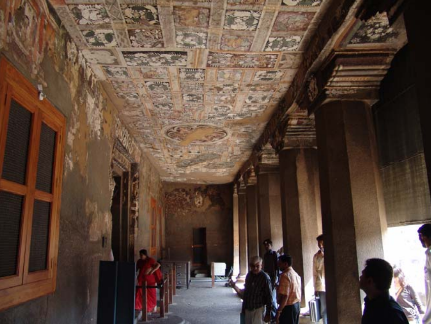
图38 修復後壁画(左)、同部分(右):第17石窟