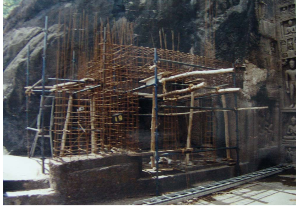
図26 第19石窟右祠堂 復原前（左）と復原工事中（右）