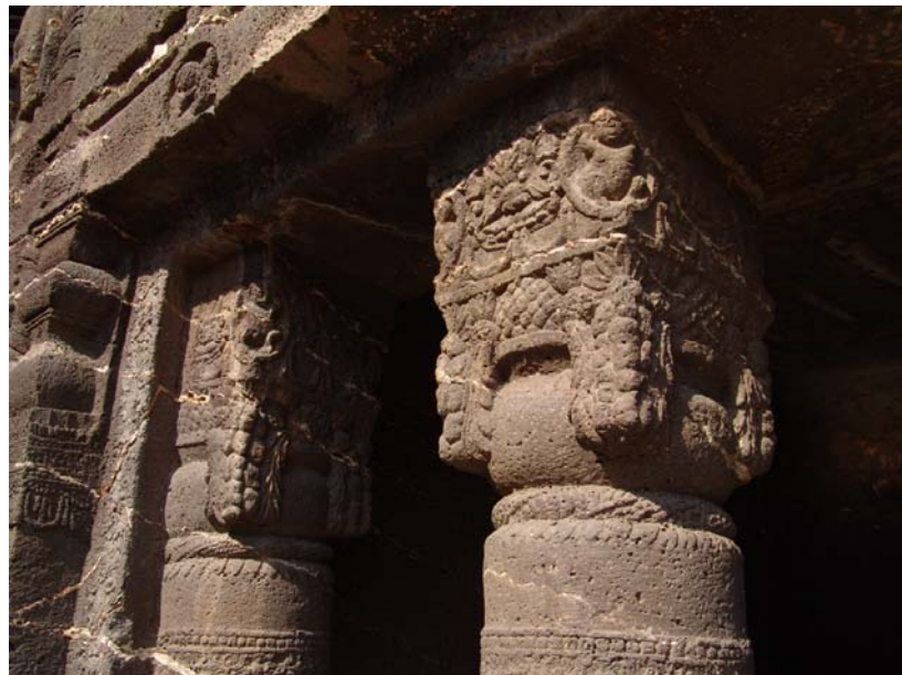
図27 第19石窟右祠堂の復原柱頭（左）と左祠堂のオリジナルの柱頭（右）