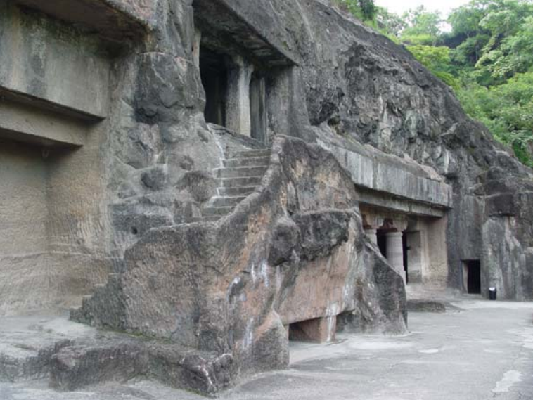
図30 第22石窟の復原ファサード