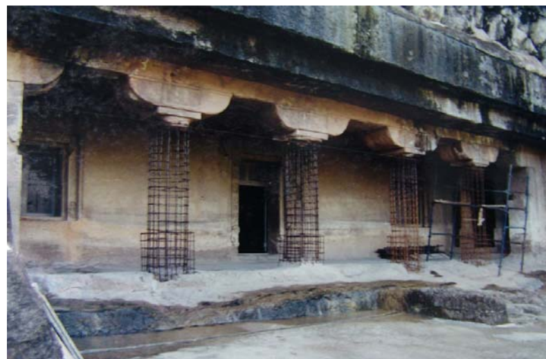
図29 第21石窟の復原前(左)と復原工事中(右)