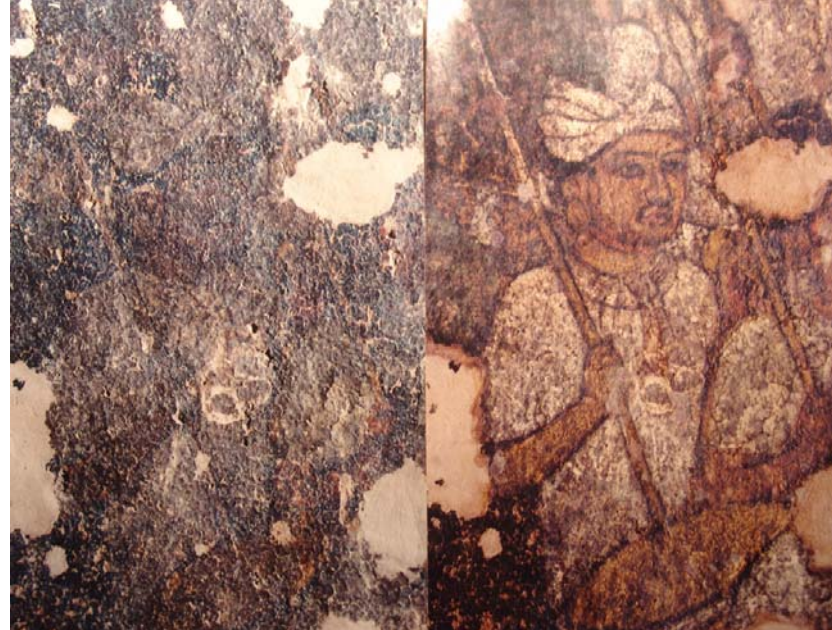
図37 壁画の修復前(左)と修復後(右)