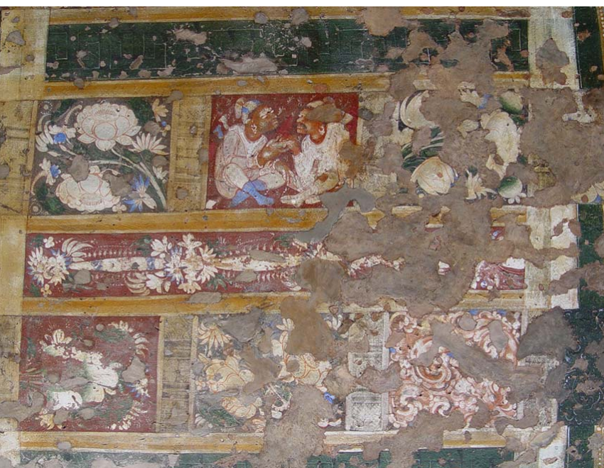
图39 修復後天井壁画:第2石窟