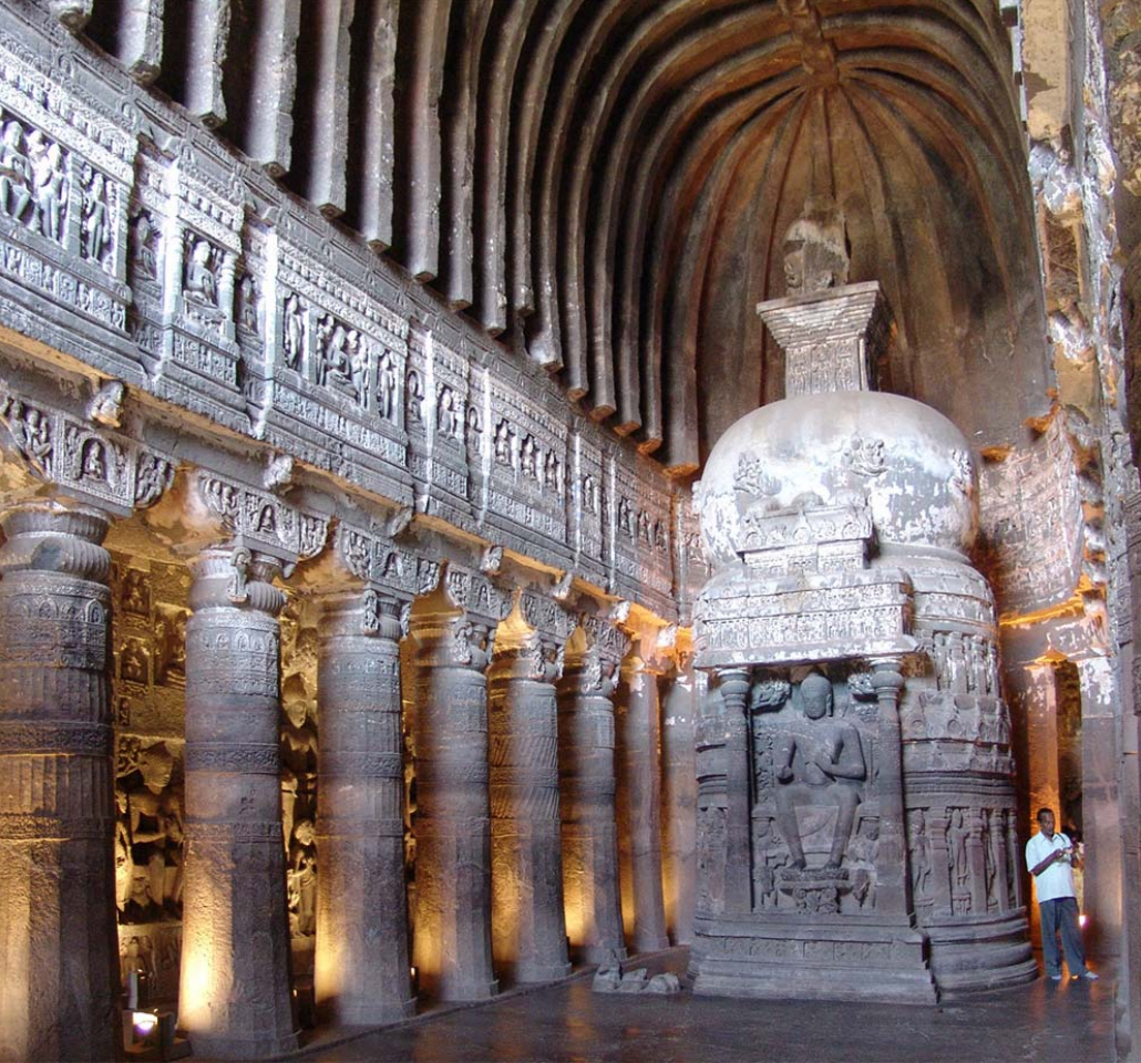
図42 白熱灯による通常照明:第26石窟