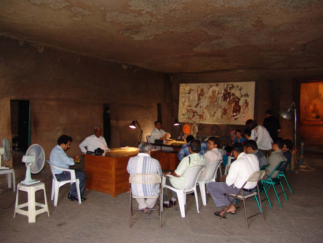
図36 第25石窟内に設営されている保存科学研究室