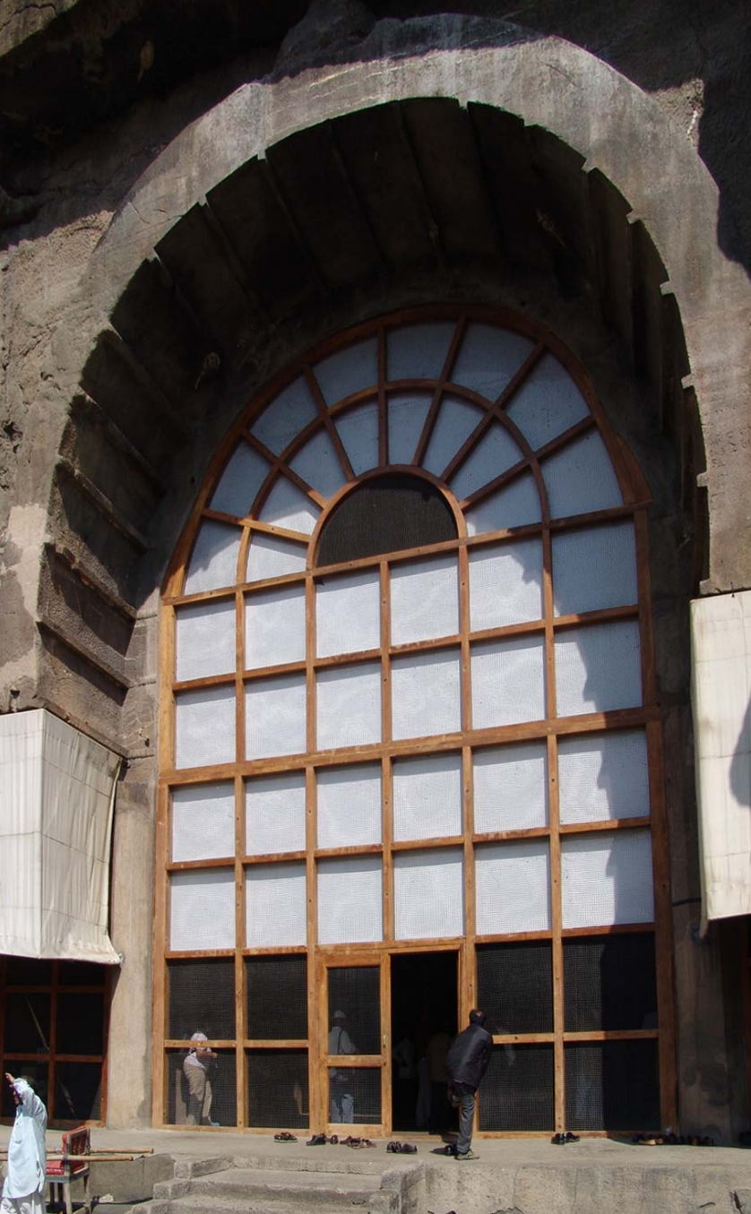
図33 コウモリ防止網戸：第10石窟