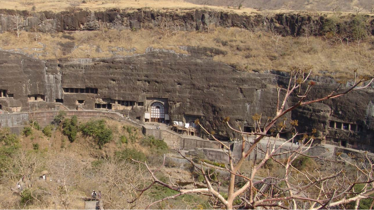
図67 アジャンタ遺跡第10石窟の遠景