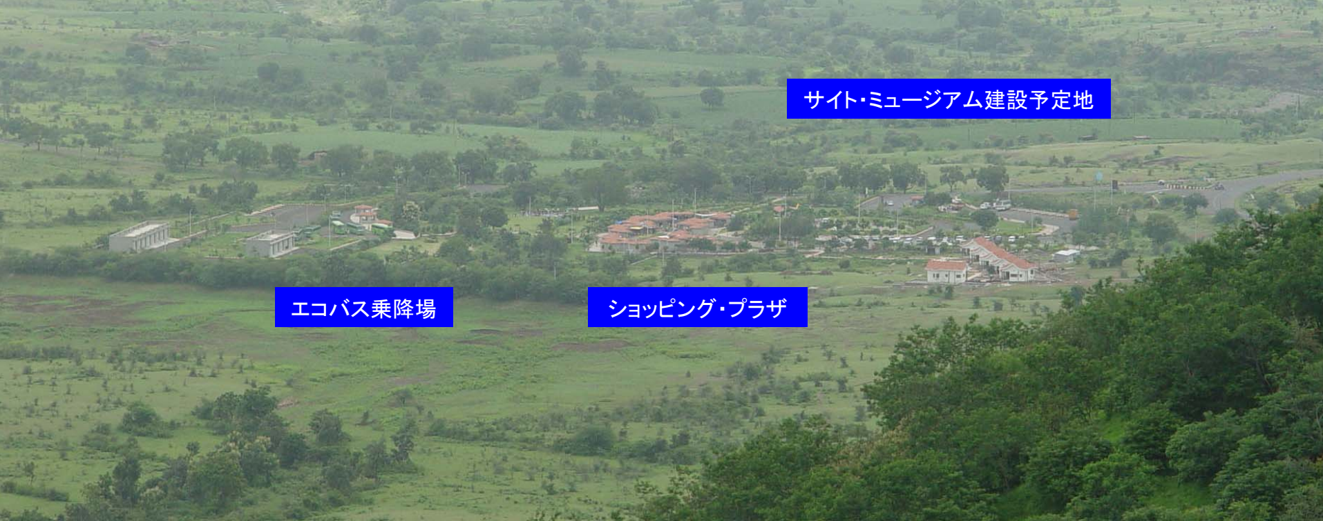
図61 Tジャンクションのショッピング・プラザと エコバス乗降場