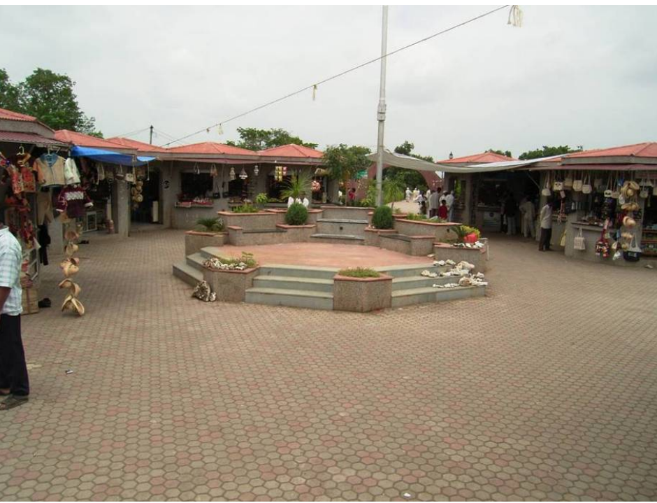
図63 Tジャンクションのショッピング・プラザ