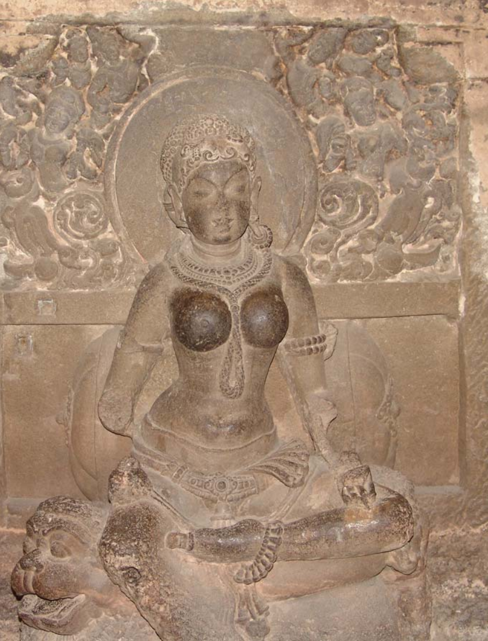
図65 エローラ遺跡第30石窟の彫刻