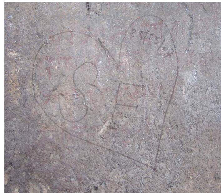
図66 エローラ遺跡第12石窟に彫り込まれた落書き