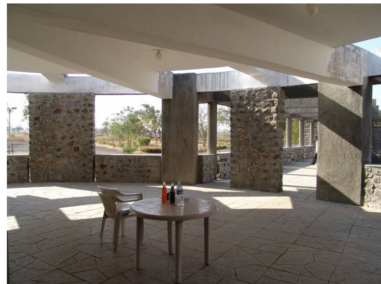
図71 ビューポイントに設けられたレストラン