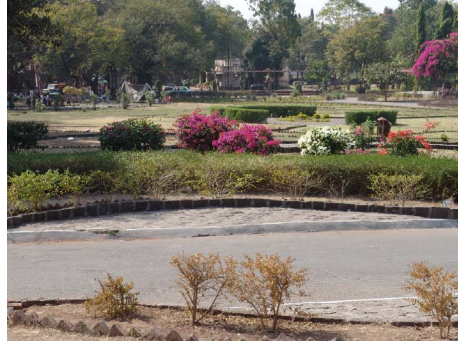
図69 エローラ遺跡第16石窟前の造園・美化整備