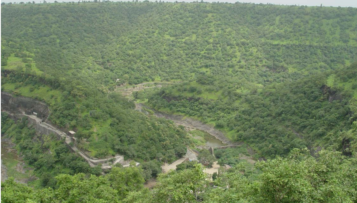
図73 アジャンタ遺跡対岸の植林