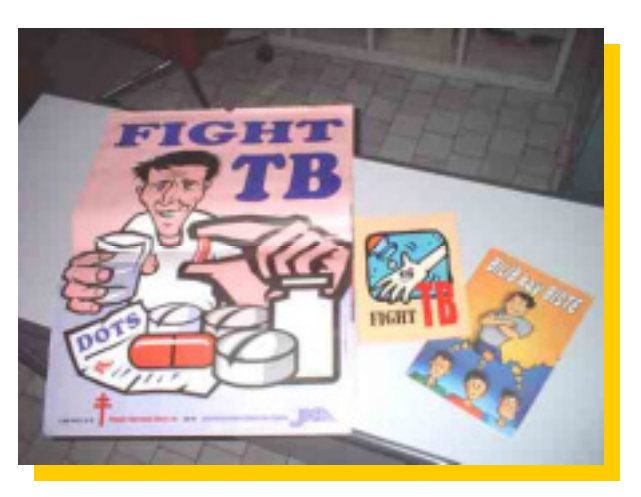
開発福祉支援:「貧困層結核患者救済」で開発された IEC 教材