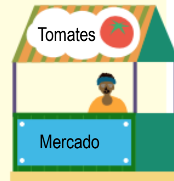
Actor del mercado

Nosotros les compramos repollos a los productores locales, pero suelen tener hojas dañadas. No podemos comprarles más caro por la baja calidad.