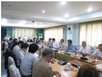
【現地業界団体訪問】