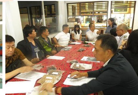
ビトゥンでの現地企業訪問