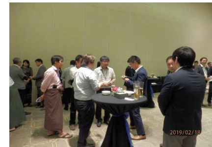
【日系企業とのネットワーキング】