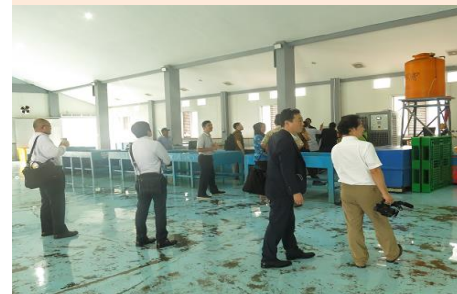
ビトゥン海洋漁港視察