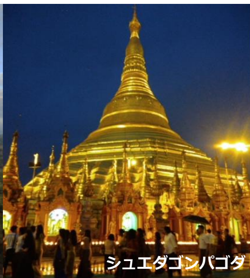
シュエダゴンパゴダ