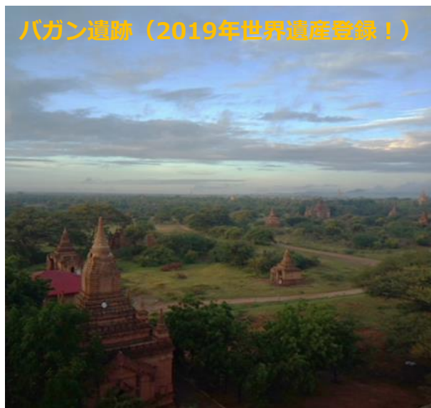
バガン遺跡（2019年世界遺産登録！）