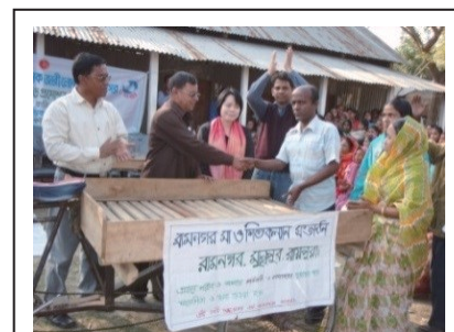
Fourniture par le président du syndicat d'un pousse-pousse pour le groupe de résidents de la communauté.

Pendant la phase I du SMPP, dans le cadre des activités communautaires, des groupes de résidents ont été mobilisés afin de renforcer la préparation à l'accouchement et aux cas d'urgence dans la communauté. Les principales activités de ces groupes sont : a) l'identification et le suivi de toutes les femmes enceintes dans la communauté, b) la création d'un fonds communautaire afin de fournir l'assistance nécessaire pour les accouchements et les urgences, c) les campagnes de sensibilisation pour un accouchement sans risques et d) la promotion de la compréhension dans les familles des femmes. Les groupes comptent approximativement autant de membres féminins que masculins. Tandis que les chefs religieux ainsi que les belles-mères faisaient obstacle au lancement des activités de la communauté, les groupes ont progressivement gagné la confiance des membres de la communauté grâce à des activités d'assistance telles que la fourniture de services de transport à l'hôpital pour les femmes en cas de complications liées à l'accouchement ou d'autres situations d'urgence. Finalement, les groupes ont obtenu le soutien des administrations locales et des dirigeants de la communauté. Avec la combinaison du soutien communautaire et des