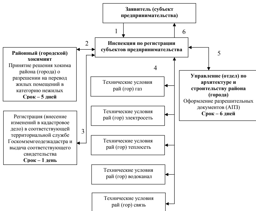
СХЕМА оформления разрешительных документов для перевода жилых помещений в категорию нежилых

По принципу «одно окно» в настоящее время осуществляется выдача такого документа разрешительного характера как решение о переводе жилого помещения в категорию нежилого. Ниже приведена схема оформления разрешительных документов для перевода жилых помещений в категорию нежилых .