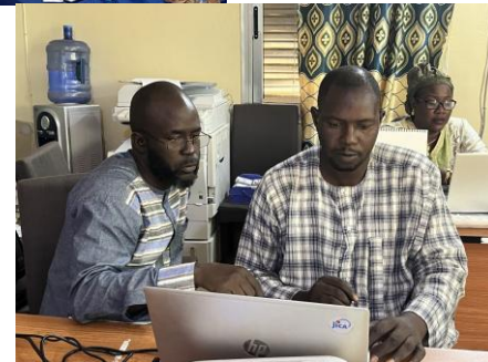
Suivi et évaluation de l'utilisation des outils comptables