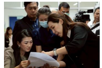
Personnel hospitalier thaïlandais apportant des conseils au personnel lao lors d'une formation (Thaïlande)