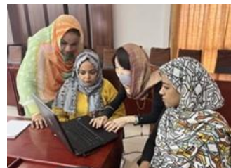
Un expert japonais conseillant des formateurs lors d'une formation à l'accréditation des établissements (Soudan)

Fonctionnaires et professionnels de la santé formés aux systèmes de protection financière et à la CSU