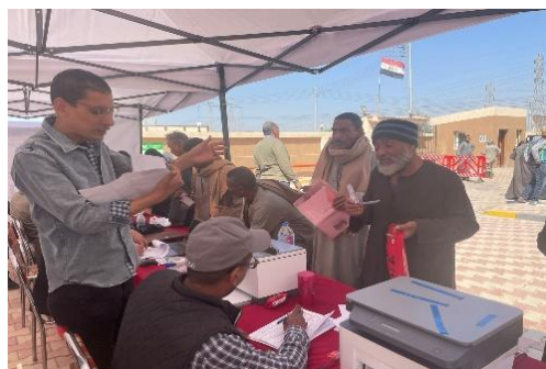
Campagne promotionnelle d'inscription et de collecte de primes à l'UHS