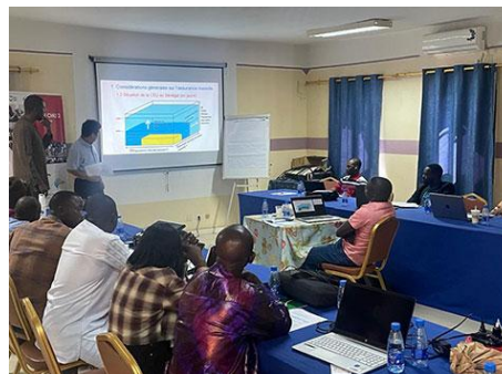
Une formation de renforcement des capacités pour le personnel de l'unité d'assurance santé du département

Grâce au DPL, la JICA apporte un appui au niveau des politiques, incluant une aide financière pour les primes subventionnées en faveur des populations défavorisées et l'élaboration de stratégies de financement de la santé. Les projets de coopération technique visent à renforcer les capacités organisationnelles par la formation et la fourniture d'équipements, ainsi qu'à améliorer les capacités de suivi des agences chargées de la mise en œuvre de l'assurance santé et des prestataires de soins dans les régions ciblées. Ces actions contribuent à renforcer la capacité de mise en œuvre des systèmes d'assurance santé communautaires à tous les niveaux.