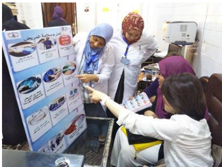
L'équipe de gestion qualité de l'hôpital discute des affiches sur la sécurité des patients