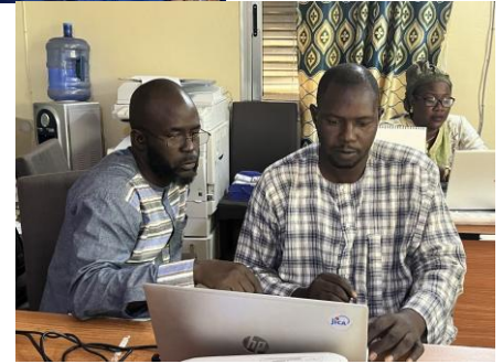
会計ツールの使用状況をモニタリングする様子