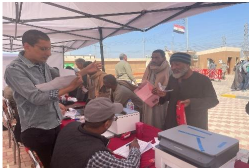
UHS加入者登録と保険料徴収推進キャンペーンの様子