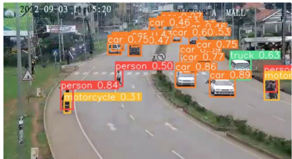
受講者が実施した『動画からの物体検出』デモ