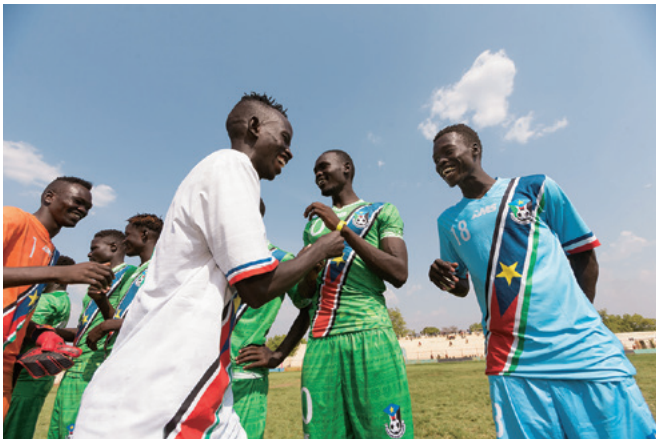
JICAが南スーダン「スポーツを通じた平和促進プロジェクト」において、開催を支援している全国スポーツ大会「国民結束の日」、2019年の開催風景。

約半世紀におよぶ内戦を経て2011年に独立した南スーダンでは、独立後も国内で政治的な争いや民族同士の争いが続いていた。そこで、次世代を担う若者たちに、スポーツを通じて民族の対立を超え、国民同士が信頼して結束する重要性を伝えたいという思いから、JICAは南スーダン青年・スポーツ省と連携して、16年より「国民結束の日」（全国スポーツ大会）の開催を始めました。16年の第1回大会以降、年に一度開催され、徐々に競技種目も増加。全12地域が代表選手を派遣するようになり、開催中は異なる部族の若者が交流する場面も多く見られています。