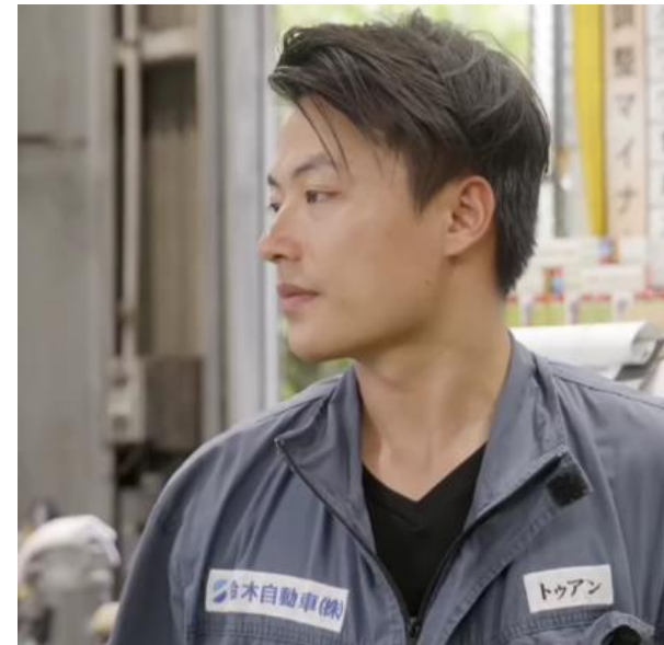
トゥアン君（28歳） 5年目