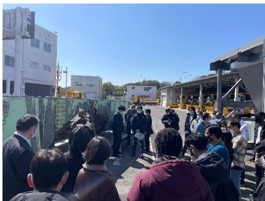
写真 3 I-TR 概要説明 (2)