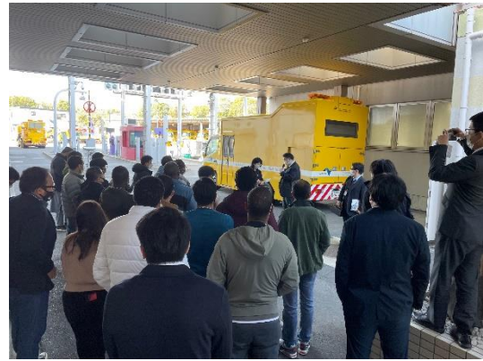
写真 2 I-TR 概要説明 (1)