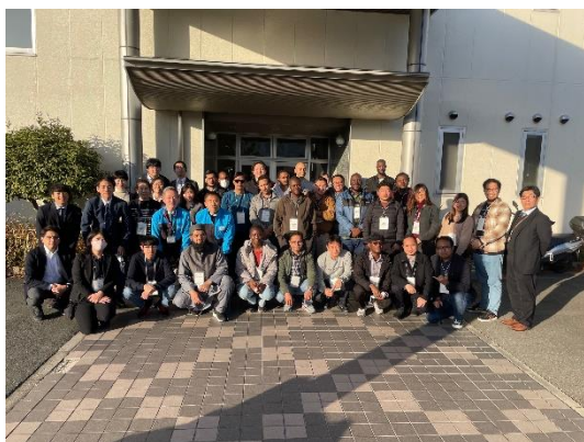
写真 5 吹田管制センター