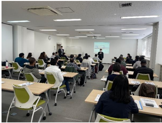
写真 1 NEXCO 西日本会社概要説明