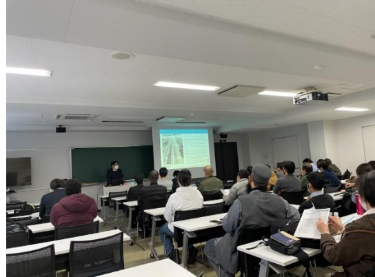
写真8 NEXCO 海外事業説明