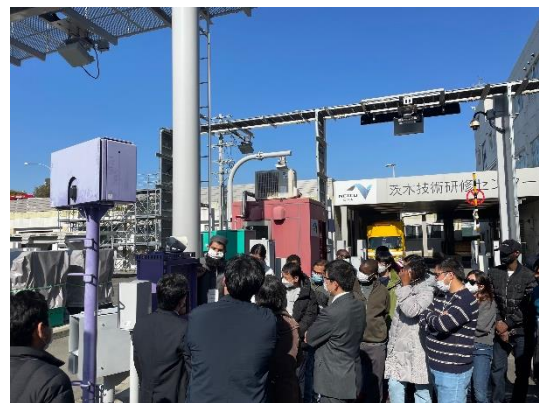
写真 4 高速道路の料金機械について