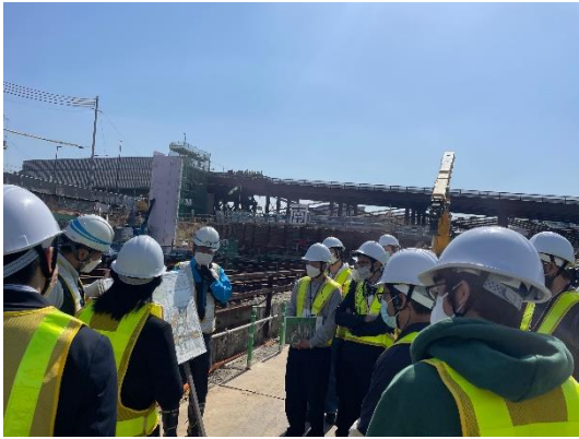
写真7 新名神大阪東工事事務所