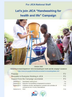
ナショナルスタッフ向け