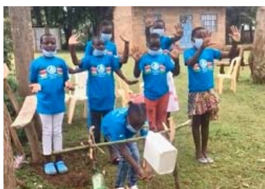
Tippy Tap を使って手洗いをする「スマイルトイレプロジェクト」実施地域の子ども達

9 月下旬に初会合をもち、何ができるかをブレスト。色々なアイデアが出ましたが、まずは 10 月 15 日の「世界手洗いの日」に向けて動画を制作することになりました。