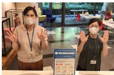
まずはスタッフによる手洗い

JICA 東京では、「健康と命のための手洗い運動」を推進すべく、課を越えて有志 8 名で「手洗いチーム」を結成しました！