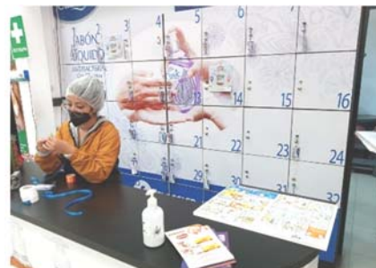
スーパーマーケットの荷物置き場に置かせてもらった手洗い啓発のポスター

その他、ラジオでも手洗い啓発を含む新型コロナウイルスへの注意喚起の CM を流しており、山奥のテレビの電波の届かないエリアにもメッセージを伝えています。今後、ポスターやテレビ、インターネットを通じた手洗い啓発ビデオと合わせてこれらのメッセージを発信することで、どこまで相乗効果が表れるか、結果的にどれほど現地にインパクトを残せるか、モニタリングを継続したいと考えています。