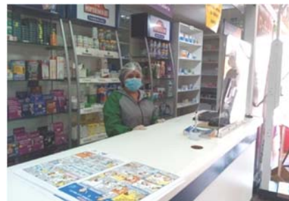
薬局のカウンターにも