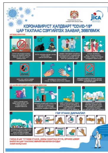
一般市民及び企業向けのポスター

モンゴルでは新型コロナウイルスの市中感染が確認され、現在ロックダウン措置が取られていますが、ごみは日々発生しており、研修参加者たちも現場で仕事を続けています。本事業で得られた知識を十分活用し、安全に廃棄物が処理され、感染が最小限に留まることを強く願っています。