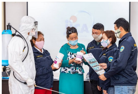
正しい手の洗い方、マスクのつけ方を教えている様子