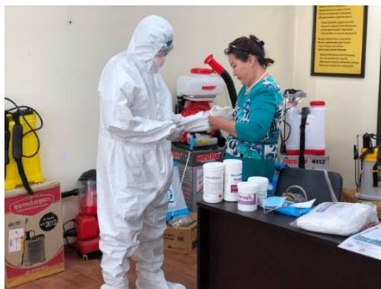
廃棄物回収職員に対してマスクや手袋の正しいつけ方を教えている様子