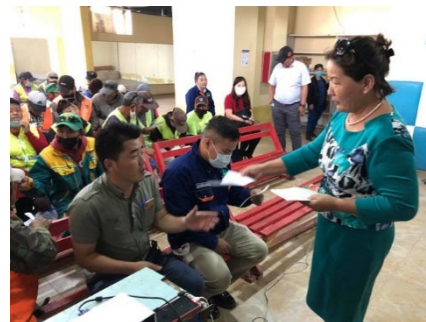
ごみ収集員へのセミナーの様子

注：ウランバートル市では研修を実施した 2020 年 8 月 19 日時点で、海外から帰国した新型コロナウイルス感染者数は 298 人でしたが、国内市中感染者数は 0 人の状況でした。