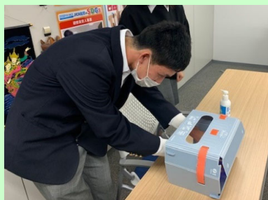
来訪者利用の様子

9 月 7 日に JICA 内部ポータルに掲載された JICA「健康と命のための手洗い運動」事務局からのお知らせで、『手洗いチェッカー』が貸出可能と知り、北陸センターでは試しにレンタルをしました。当初の目的は北陸センター内での健康管理を目的とした、手洗いの啓発活動でしたが、スタッフが使用した感想から「外部の来訪者にも利用してもらおう」ということになり、北陸センター入口に設置し、北陸センター Facebook 記事 ( 掲載内容はこちら ) でもお知らせしました！