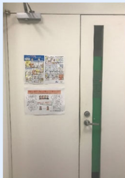
JICA 本部 執務室のドアに掲示している手洗いポスター(上側)

翻訳言語：英語、フランス語、スペイン語、カンボジア語、テトゥン語、スワヒリ語、シンハラ語、タミル語、マダガスカル語、ビジン語、タイ語、アムハラ語、アラビア語、ロシア語、キルギス語、ヒスラマ語、ディベヒ語、ヒンディー語、ベンガル語、ネパール語、モンゴル語、ダリ語、インドネシア語、ウクライナ語