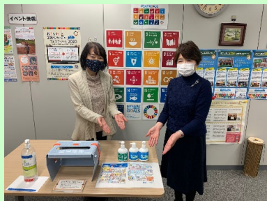
JICA 北陸スタッフと手洗いチェッカー設置の様子

JICA 地球環境部では 2020 年 9 月より、適切に手洗いでできているか確認できるツールの JICA 内への貸し出しを行っています。今回は、JICA 北陸センターからその活用報告をお伝えします。