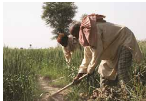
借入人の作業風景