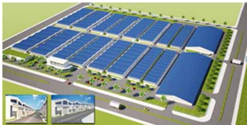
<レンタル工業団地完成予想図>