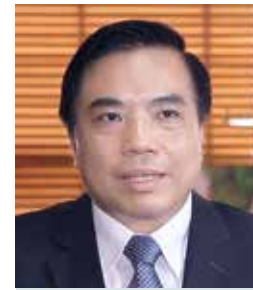
外国貿易大学 学長 ブイ・アン・トゥアン

ベトナム日本人材開発インスティテュート（VJCCインスティテュート）は、2000年に日本政府の対ベトナム ODA事業の下、国際協力機構（JICA）と外国貿易大学（FTU）の協力により設立されて以来、ベトナム人材の育成に力を注ぎながら、発展の歩みを続けています。その中で、VJCCインスティテュートは常に国際的な変革とトレンドを把握し、質の高い教育環境を整え、新しい挑戦的な取り組みを行うビジネス人材を育成すると同時に、「ベトナム国内および国際的に高く評価されるイノベーション大学になる」という FTUの戦略目標の達成に寄与するよう努めています。VJCCインスティテュートは、日本の大学や企業を中心とする、内外の機関・団体、大学、企業の3者との強力な国際的ネットワークを活用し、FTUのモットーである「Difference to lead」を実践するために、全てのプログラムにおいて、これまで蓄積してきたビジネス研修や企業支援の経験を継承し発展させてゆきます。このような取り組みを通じて、VJCCインスティテュートは、起業家や学生がベトナムを越えて東南アジア、日本、そして世界へと活躍の場を広げることを総合的に支援できると考えています。