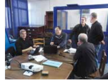
خبير ياباني في مجال المصايد