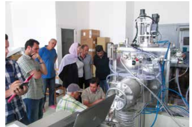
خبير بمخبر هندسة الزلازل CGC (إرسال خبراء) (2014-2018)