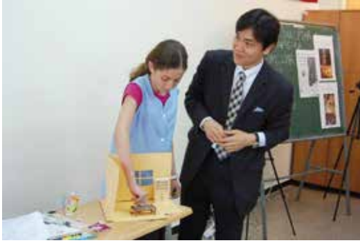
دروس بيانية موجهة للتلاميذ