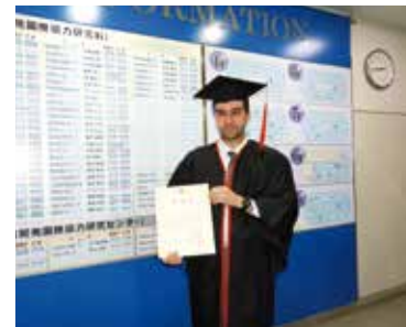
إسناد شهادة لطلاب سابق (مبادرة ABE)