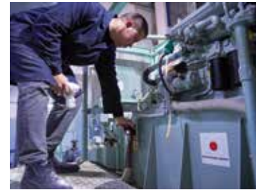
استخدام المعدات الممنوحة (2022)