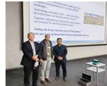
طالب في اليابان (مبادرة ABE)