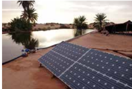
مركز البحوث حول الطاقة الشمسية في الصحراء.