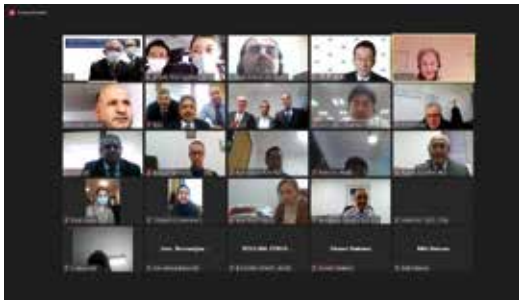
تدعيم الحوكمة المالية في الجزائر برنامج ملتقيات عبر النت (2021)