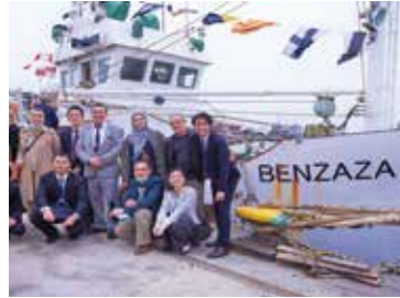
قارب تدريب بنزازا (2022)