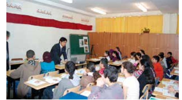
مشروع إعادة بناء المؤسسات التعليمية التي ضربها الزلزال (قرض) (2005)