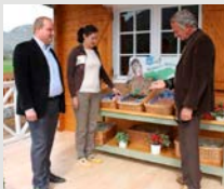
Projekti i përfshirjes financiare të familjeve të vogla në Shqipëri

Për zhvillimin e burimeve njerëzore dhe formulimin e sistemeve administrative në vendet në zhvillim, bashkëpunimi teknik përfshin dërgimin e ekspertëve, sigurimin e pajisjeve të nevojshme dhe trajnimin e stafit nga vendet në zhvillim në Japoni dhe vende të tjera. Planet e bashkëpunimit mund të përshtaten sipas gamës së gjerë çështjesh.