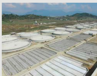
Projekti i Përmirësimit të sistemit të kanalizimeve të Tiranës së Madhe

Kreditë ODA mbështesin vendet në zhvillim përmes financimit afatgjatë dhe mjeteve financiare koncesionale me interes të ulët. Kreditë ODA përdoren për infrastrukturë të proporcioneve të mëdha dhe forma të tjera të zhvillimit për të cilat nevojiten mjete të konsiderueshme.