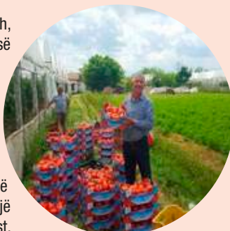
Përdoruesit e projektit

Ekonomia e Shqipërisë është e bazuar në një segment të madh, tek ekonomitë e vogla dhe sipërmarrja familjare. Dyzet e pesë përqind e popullsisë së saj jeton në zonat rurale. Sektori i bujqësisë ka një nga kontributet më të mëdha në PBB. Nga ana tjetër, vëllimi i përfshirjes financiare në Shqipëri është i ulët. Vetëm 38% e njerëzve mbi 15 vjet kanë llogari bankare në institucionet formale financiare, gjë që lë shumë familje pa qasje në shërbimet financiare. Për të adresuar këtë çështje, JICA dhe Qeveria Shqiptare kanë ndërmarrë këtë projekt. Projekti ka për qëllim të përmirësojë aksesin financiar të fermerëve të vegjël përmes FED Invest, agjencisë që zbaton projektin.