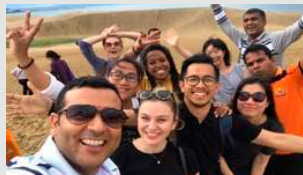
Trajnimiti në Japoni: Zhvillimi i kapaciteteve në turizmin e qëndrueshëm të bazuar në traditën japoneze "Omotenashi - mikpritje"