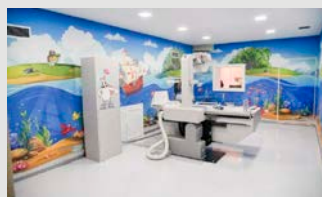
Klinika Pediatrike e Qendrës Spitalore Universitare "Nënë Tereza" nga Tirana

Grantet janë burime financiare që i ipën vendeve në zhvillim të cilat kanë të ardhura të ulëta, pa detyrim shlyerje. Grantet përdoren për të përmirësuar infrastrukturën themelore siç janë shkollat, spitalet, hidraulikët dhe rrugët, si dhe për marrjen e kujdesit shëndetësor dhe mjekësor, furnizimin me pajisje dhe kërkesa të tjera.