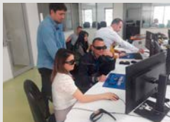
Projekti për informacionin gjeohapësinor dhe zhvillimin e qëndrueshëm të tokës në zonën Tiranë-Durrës