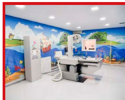
Klinika e Pediatricës e Qendrës Spitalore Universitare "Nënë Tereza" në Tiranë

prej 570,000 USD. Qëllimi kryesor i këtij projekti është mirëmbajtja e diagnostikimit dhe trajtimit të shpejtë në spitalin Pediatric për foshnje dhe fëmijë. Pajisje mjekësore të reja, të tilla si radiografia dhe fluoroskopia me reze X, imazheri me ultratinguj, monitorët e pacientëve, nebulizatorët, aspiratorë, si dhe pjesët këmbimi u janë dorëzuar Klinikës së Pediatricës të Qendrës Spitalore Universitare "Nënë Tereza" gjatë vitit 2016-2017.