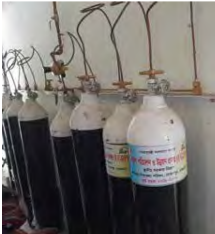
উপজেলা স্বাস্থ্য কমপ্লেক্স, মোহনপুর, রাজশাহীতে অক্সিজেন সিলিন্ডার স্থাপন করা হয়েছে