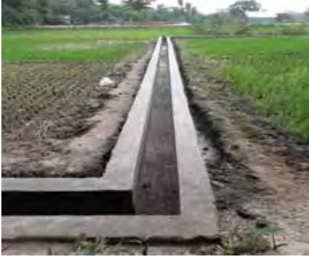
নির্মিত সেচ ড্রেন

শিক্ষা খাতের উন্নতি: অটিজমে আক্রান্ত শিশুদের জন্য একটি নতুন স্কুল ভবন নির্মাণের ফলে শিশুদের জন্য শিক্ষার সুযোগ বৃদ্ধি পেয়েছে এবং প্রতিবন্ধী শিশুদের অধিকার নিশ্চিত হয়েছে। স্কুল ভবনগুলোর সংস্কার এবং সম্প্রসারণও স্কুলে শিক্ষার্থীদের সংখ্যা বাড়িয়ে তুলছে এবং স্কুল পরিচালকগণ গ্রামীণ শিশুদের জন্য আরও ভাল শেখার পরিবেশ এবং সুযোগ প্রদান করতে পেরেছেন। আসবাবপত্র এবং কম্পিউটার / ল্যাপটপের সরবরাহের মাধ্যমে গ্রামীণ স্কুল ব্যবস্থায় শিক্ষার মান উন্নয়ন হয়েছে। প্রয়োজনীয় সংখ্যক কম্পিউটার, ল্যাপটপ, প্রিন্টার, মাল্টিমিডিয়া প্রজেক্টর, স্ক্যানার ইত্যাদি নিয়ে শিক্ষা খাত আইসিটিতে সমৃদ্ধ হয়েছে। শিক্ষা খাত এখন অবকাঠামো, আসবাবপত্র এবং শিক্ষার সরঞ্জামগুলোর ক্ষেত্রে আরও দক্ষ, যা মানসম্পন্ন শিক্ষা নিশ্চিত করতে সহায়তা করছে।