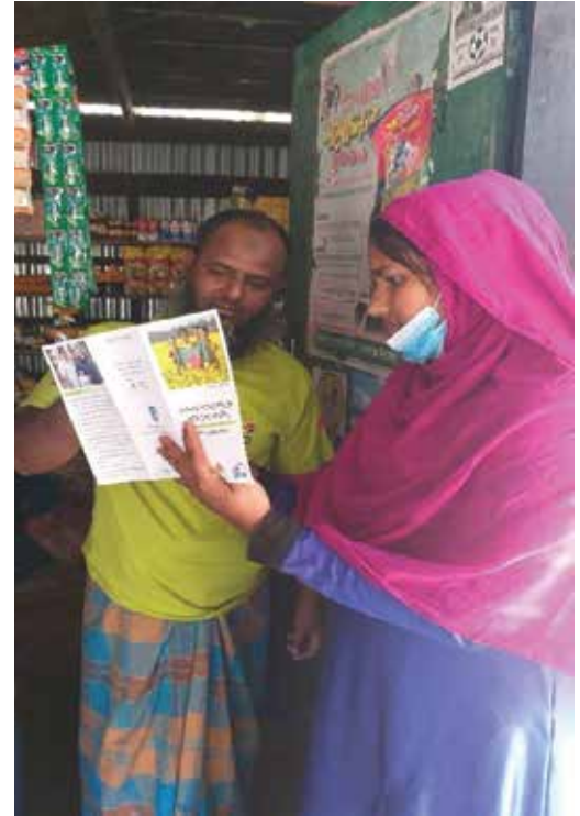
স্থানীয় লোকজন এনআইএস লিফলেট পড়ছেন