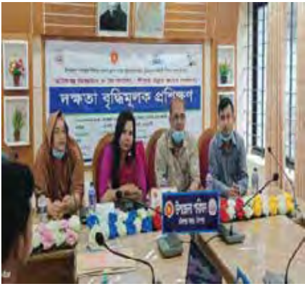
বেকার যুবকদের জন্য একটি দক্ষতা উন্নয়ন প্রশিক্ষণের

কৃষি উৎপাদন বৃদ্ধি: সেচ নালা বিভিন্নভাবে উপকার করেছে। এটি শুষ্ক মৌসুমে পানির অপব্যবহার রোধ করে এবং ধান ও অন্যান্য ফসলের কম খরচে উৎপাদনের সুবিধা প্রদান করে। এটি ব্যাপকভাবে খাদ্য নিরাপত্তায় অবদান রাখছে। প্রায় ১,৭০০ জন কৃষক ইউজিডিপি সহায়তায় সেচ সুবিধা ব্যবহার করছেন এবং ৩০০ একর জমি সেচের আওতায় আনা হয়েছে। এটি প্রায় ৫০০ মেট্রিক টন ধান উৎপাদনে সহায়তা করবে এবং ৭০,০০০ মানুষ এই উপ-প্রকল্পের পরোক্ষ সুবিধাভোগী হবে।