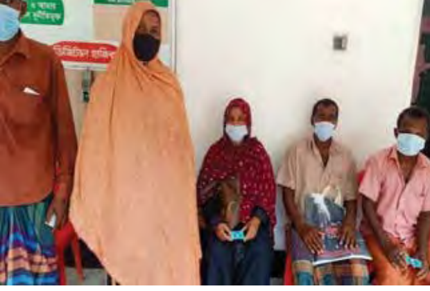
টোকেন সহ সেবাপ্রার্থীরা

ইউএনও সবার কাছে সুষ্ঠু ও নিয়মতান্ত্রিক সেবা পৌঁছে দেওয়ার লক্ষ্যে ২০২২ সালের ফেব্রুয়ারি মাসে তার কার্যালয়ে টোকেন সিস্টেম