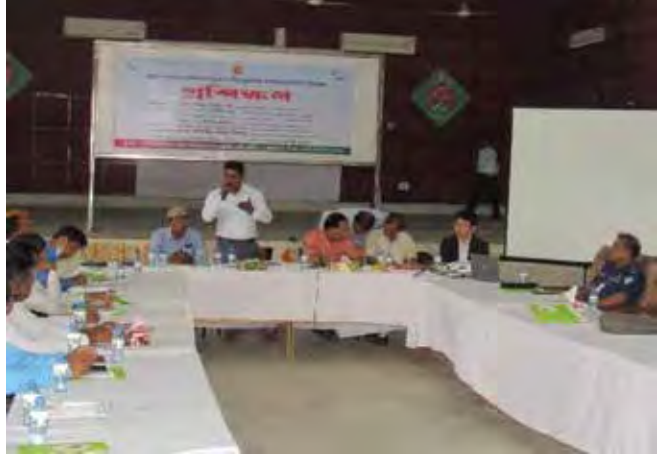
ইউএনও সভাপতিত্ব করছেন এবং প্রশিক্ষণ পরিচালনা করছেন

ফকিরহাট উপজেলা পরিষদ এনআইএস বাস্তবায়ন প্রসারিত করার সিদ্ধান্ত নেয় এবং ২০২২ সালের ২০ শে মার্চ প্রথমবারের মতো টিএলডি অফিসার এবং উপজেলার নির্বাচিত প্রতিনিধিদের জন্য এনআইএস প্রশিক্ষণের ব্যবস্থা করার জন্য ইউজিডিপিতে সিডিএসপি প্রস্তাব জমা দেয়। ইউজিডিপি ২৭ শে মার্চ ১,৬০,০০০ টাকা আনুমানিক প্রশিক্ষণ ব্যয়সহ তৎক্ষণাৎ প্রস্তাবটি অনুমোদন করে। ফকিরহাট উপজেলা পরিষদ ২০২২ সালের ৩১ মে থেকে ২ জুন পর্যন্ত এনআইএস প্রশিক্ষণের আয়োজন করে।