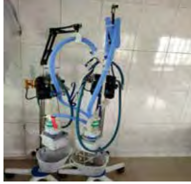
উপজেলা স্বাস্থ্য কমপ্লেক্স, দাগনভূঁইয়া, ফেনীতে স্থাপিত অক্সিজেন সিলিডারের কার্যকর ব্যবহার নিশ্চিত করার জন্য স্থাপন করা সংশ্লিষ্ট ডিভাইস