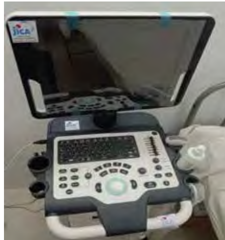
উপজেলা স্বাস্থ্য কমপ্লেক্স, তানোর, রাজশাহীতে আল্ট্রা-সোনোগ্রাফি মেশিন সরবরাহ করা হয়েছে