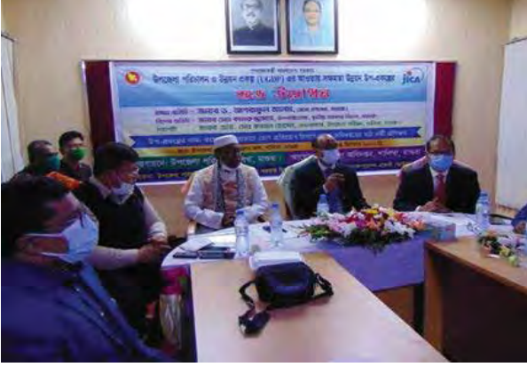
জেলা প্রশাসক, মাগুরা শালিখা উপজেলায় কোভিড-১৯ প্রতিরোধ বিষয়ক স্বাস্থ্যকর্মীদের প্রশিক্ষণের উদ্বোধন করেন।

কোভিড-১৯ মহামারির মধ্যে নেওয়া হয়েছিল, তথাপিও এই কর্মসূচির প্রভাব অবশ্যই বহুগুণ বর্ধিত আকারে জনজীবনে ইতিবাচক প্রভাব ফেলবে বলে আশা করা যায়। উপজেলা স্বাস্থ্য কমপ্লেক্সগুলোতে ইউজিডিপি দ্বারা সরবরাহ করা চিকিৎসা সরঞ্জাম এবং ডিভাইসগুলো মহামারি শেষ হওয়ার পরেও গুরুতর শ্বাসযন্ত্রের ব্যাধি এবং অন্যান্য জরুরি ক্ষেত্রে রোগীদের চিকিৎসার জন্য ব্যবহার করা যেতে পারে। একইভাবে, স্বাস্থ্যসেবা প্রদানকারী এবং কমিউনিটি হেলথ ওয়ার্কাররা সেই অনুযায়ী সিডিএসপি প্রশিক্ষণের মাধ্যমে তাদের অর্জিত জ্ঞান ব্যবহার করতে সক্ষম হবে।