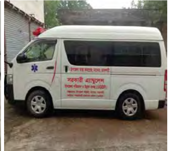
উপজেলা স্বাস্থ্য কমপ্লেক্স, তানোর, রাজশাহীতে আল্ট্রা-অ্যাম্বুলেন্স মেশিন সরবরাহ করা হয়েছে

এছাড়াও, ৪র্থ রাউন্ডের জন্য নির্বাচিত সকল উপজেলায় মোট ৪৫৩টি কোভিড-১৯ প্রতিরোধমূলক ক্যাপাসিটি ডেভেলপমেন্ট উপ-প্রকল্প (সিডিএসপি) বাস্তবায়িত হয়েছে। এই সিডিএসপিগুলোর মধ্যে, যথাক্রমে ৪০১টি প্রশিক্ষণ, ৩২টি কর্মশালা, ১০টি কোভিড-১৯ বিষয়ে ওরিয়েন্টেশন প্রোগ্রাম, ৬টি প্রচারাভিযান এবং ৪টি সেমিনার আয়োজিত হয়েছিল। স্বাস্থ্যসেবা প্রদানকারী এবং কমিউনিটি হেলথ কর্মীসহ মোট ৫৩,০৭৩ জন এই প্রোগ্রাম গুলোর সুবিধাভোগী ছিলেন। যদিও “কোভিড-১৯ প্রতিরোধমূলক উপ-প্রকল্প” বাস্তবায়নের সিদ্ধান্ত