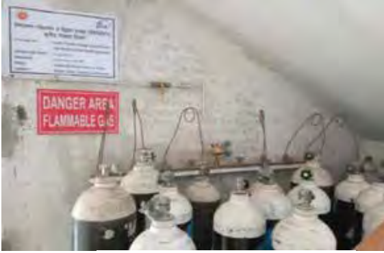
উপজেলা স্বাস্থ্য কমপ্লেক্সে সাজানো অক্সিজেন সিলিডার, গোমস্তাপুর, চাঁপাইনবাবগঞ্জ।

৪র্থ রাউন্ডে যোগ্য বিবেচিত সকল উপজেলায় মোট ৩৫৫টি কোভিড-সম্পর্কিত অবকাঠামো উন্নয়ন উপ-প্রকল্প (INFSP) বাস্তবায়িত হয়েছে, (সারণি-১) দ্রষ্টব্য। এর মধ্যে ১২১টি উপ-প্রকল্প ছিল সেন্ট্রাল অক্সিজেন সাপ্লাই সিস্টেম (সিওএসএস) স্থাপন, যা উপজেলা স্বাস্থ্য কমপ্লেক্সে সরাসরি কোভিড-১৯ রোগীদের চিকিৎসার জন্য ব্যবহার করা হচ্ছে। এই ১২১টি সিওএসএসের মধ্যে সতেরোটি হাই ফ্লো নাসাল ক্যানুলা (HFNC) এর সংমিশ্রণে ইনস্টল করা হয়েছে। ল এবং ১০টি অন্যান্য চিকিৎসা সরঞ্জামের সাথে সম্পৃক্ত ছিল। উল্লেখ্য, এই ১২১টি COSS ২,১৬৫টি আউটলেটের মাধ্যমে ২,১৬৫ রোগীর বেডের সাথে সংযুক্ত করা হয়েছে। অন্যদিকে, অবশিষ্ট ২৩৪টি INFSP-এর মধ্যে রয়েছে বেশ কিছু চিকিৎসা সুবিধা স্থাপন এবং বিভিন্ন চিকিৎসা সরঞ্জাম সরবরাহ (সারণি ২)। জাপানসহ বিভিন্ন দেশ থেকে চিকিৎসা সরঞ্জাম আনা হয়েছে। অনুমান করা হয়েছিল যে প্রতি বছর এই ৩৫৫টি INFSP-এর সরঞ্জাম এবং সুবিধা দিয়ে প্রায় ১২৩,০০০ রোগীকে চিকিৎসা সেবা দেয়া যেতে পারে।