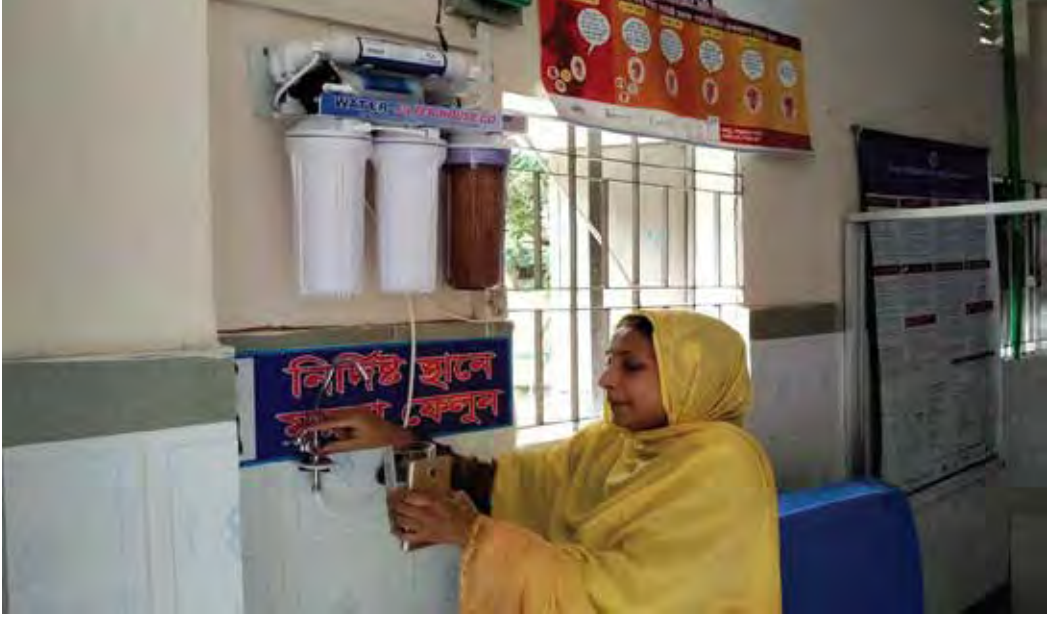
চাঁদপুর সদর উপজেলার বালিয়া ইউনিয়নের চাপিলা কমিউনিটি ক্লিনিকে নিরাপদ পানীয় জলের জন্য বৈদ্যুতিক পানির ফিল্টার স্থাপন করা হয়েছে

স্বাস্থ্য সেবা প্রদান: চাঁদপুর সদর উপজেলার কমিউনিটি ক্লিনিকে অক্সিজেন সিলিন্ডার ও চিকিৎসা সরঞ্জাম সরবরাহ করা হয়েছে, যা কোভিড-১৯ এর চিকিৎসায় ভূমিকা রাখছে। অনেক কোভিড-১৯ আক্রান্ত রোগী এই কার্যক্রমের সুফল পেয়েছেন। কমিউনিটি ক্লিনিকসমূহে বিভিন্ন চিকিৎসা সরঞ্জাম সরবরাহ এবং ৩০টি হাত ধোয়ার বেসিন স্থাপনের ফলে কোভিড-১৯ ও অন্যান্য রোগ প্রতিরোধে স্বাস্থ্য খাত অত্যন্ত উপকৃত হয়েছে। কমিউনিটি ক্লিনিকে আগত রোগীদের জন্য ৩৫টি বৈদ্যুতিক পানির ফিল্টার এবং ০৬টি গভীর নলকূপও স্থাপন করা হয়েছে।