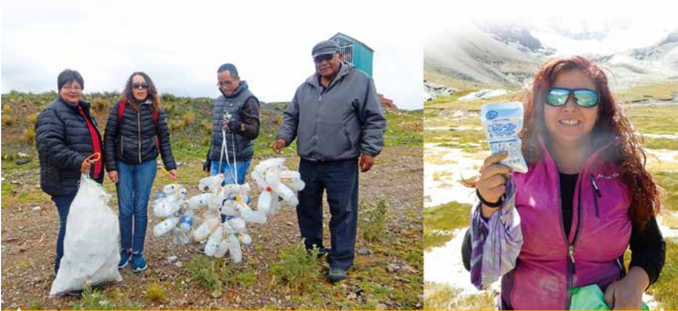
Representante País de Quimbaya Latin America y su equipo en visita del Mirador de Llocolloco