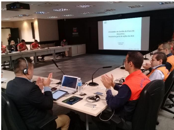
他州の市民防災局関係者も招いた「普及セミナー」