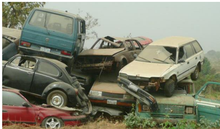
ミナス・ジェライス州交通局の盗難車回収所に羅列する自動車