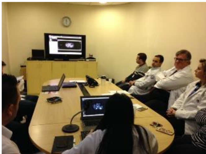
サンパウロ大学附属病院での症例検討会の様子