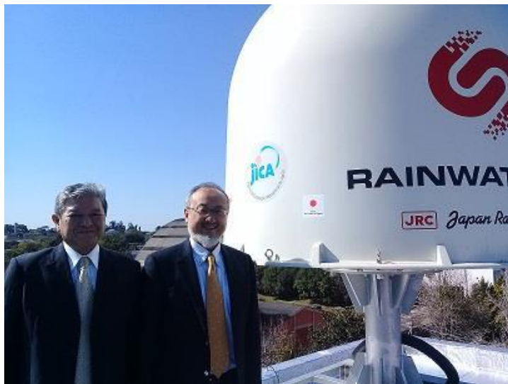
パラナ州気象局屋上に設置したXバンド雨量レーダ