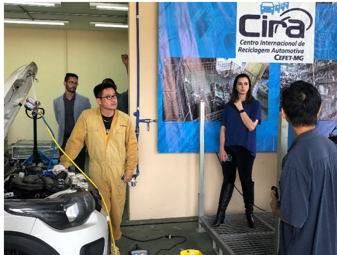
会宝産業技術者による解体技術指導の様子