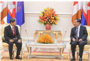
ទិដ្ឋភាពក្នុងកិច្ចប្រជុំ

ប្រធានបទមួយឈ្មោះ Meiji Restoration ចាប់ផ្តើមធ្វើទំនើបកម្មដំណើរពេញលេញក្នុងនោះ លោកបានផ្តល់ការធ្វើបទបង្ហាញនៅវិទ្យាស្ថានការទូត និងទំនាក់ទំនងអន្តរជាតិ (NIDIR) កាលពីថ្ងៃទី១៥ ខែកញ្ញា ឆ្នាំ២០២២ កន្លងទៅនេះ។ ជាងនេះទៅទៀត លោកបានធ្វើការកត់សម្គាល់ថា កត្តាជោគជ័យនៃMeiji Restoration ដោយមានការទទួលស្គាល់ជាចម្បងរបស់ជប៉ុនអំពីសារៈសំខាន់សម្រាប់សន្តិភាព និងស្ថេរភាពក្នុងការអភិវឌ្ឍជាតិ ហើយជាការពិតដែលមានមន្ត្រីរដ្ឋាភិបាលដែលមានសមត្ថភាព រួមទាំងអ្នកនយោបាយដែលកំពុងធ្វើការទៅលើបញ្ហាសំខាន់ៗសម្រាប់ជាតិ ។ បណ្ឌិតគឺតោកា ក៏បានចាប់អារម្មណ៍ ទៅលើការគាំទ្ររបស់លោកសម្រាប់រដ្ឋាភិបាលកម្ពុជា ដែលគាំទ្រការប្រឆាំងនឹងការឈ្លានពាន របស់ប្រទេសរុស្ស៊ី លើទឹកដីអ៊ុយក្រែន ហើយលោកក៏បានសង្កត់ធ្ងន់ថា នៅក្នុងស្ថានភាពពិភពលោកបច្ចុប្បន្ន គឺជប៉ុនត្រូវការដើរតួនាទី សកម្មជាងមុនដើម្បីស្វែងរកសាមគ្គីភាពជាមួយប្រទេសដទៃ ជាពិសេសប្រទេសនៅក្នុងតំបន់អាស៊ីអាគ្នេយ៍