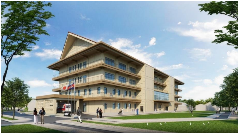
ទិដ្ឋភាពទូទៅនៃគម្រោងអាគារសំណង់របស់មន្ទីរពេទ្យបង្អែកខេត្តសៀមរាប

ទីភ្នាក់ងារចែកបាននឹងកំពុងធ្វើការជាមួយសមភាគីកម្ពុជា លើការពង្រឹងប្រព័ន្ធសុខាភិបាលដើម្បីសម្រេចបាននូវការគ្របដណ្តប់សុខភាពជាសកលត្រឹមឆ្នាំ២០៣០នៅក្នុងប្រទេសកម្ពុជាដោយបន្តជួយយុទ្ធសាស្ត្រសុខាភិបាលអស់ជាងបីទសវត្សរ៍មកហើយតាមរយៈកិច្ចសហប្រតិបត្តិការបច្ចេកទេស ជំនួយឥតសំណង និងក្របខណ្ឌផ្សេងទៀត។ មន្ទីរពេទ្យខេត្តសៀមរាបគឺជាមន្ទីរពេទ្យសាធារណៈ និង ជាមន្ទីរពេទ្យបង្អែកកម្រិតខ្ពស់នៅតំបន់ភាគពាយ័ព្យនៃប្រទេសកម្ពុជា ដែលផ្តល់នូវសេវាវេជ្ជសាស្ត្រពិសេស និងទូទៅ។ អ្នកជំងឺដែលមកសម្រាកព្យាបាលនៅមន្ទីរពេទ្យនេះ មិនត្រឹមតែជាអ្នកខេត្តសៀមរាបប៉ុណ្ណោះទេ គឺមានអ្នកជំងឺដែលមកពីបណ្តាខេត្តជិតខាងផងដែរ។ ថ្មីៗនេះ អ្នកជំងឺមិនឆ្លង(NCDs) និងអ្នកជំងឺដែលមានរបួសរាងកាយមានការកើនឡើងដោយសារការឆ្លងជំងឺ និងការកើនឡើងនៃគ្រោះថ្នាក់ចរាចរណ៍។ ប៉ុន្តែមន្ទីរពេទ្យមិនអាចផ្តល់សេវាវេជ្ជសាស្ត្រ