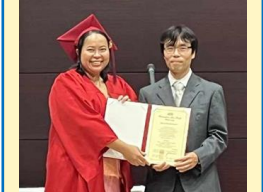
កម្មវិធីទទួលសញ្ញាប័ត្រនៅសាកលវិទ្យាល័យ Ritsumeikan Asia Pacific

និស្សិតអហារុបករណ៍ចែករំលែកសិក្សាក្នុងអំឡុងពេលវិភាគរដ្ឋបាលជប៉ុន ១៩