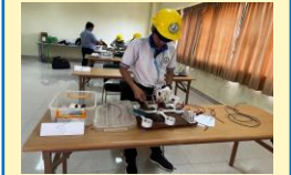
សកម្មភាពប្រឡងបញ្ចប់ការសិក្សាជាក់ស្តែងសម្រាប់មុខវិជ្ជាផ្សេងៗនៅ NTT

ផលនិយមន័យនៃការលើកស្ទួយអប់រំបណ្តុះបណ្តាលបច្ចេកទេស និងវិជ្ជាជីវៈក្នុងប្រទេសកម្ពុជា