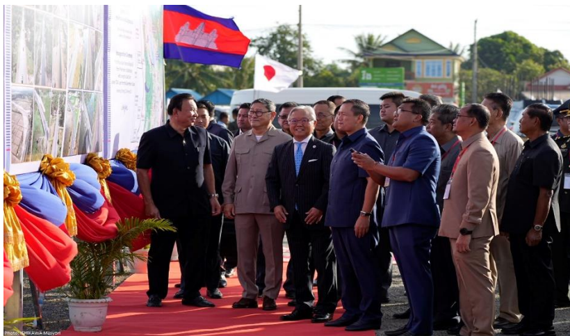
ពិធីសម្ពោធផ្លូវជាតិលេខ៥

ផ្លូវជាតិលេខ៥ ត្រូវបានគេស្គាល់យ៉ាងទូលំទូលាយថាជាផ្លូវអាស៊ានហាយវេលេខ១ និងជាផ្នែកមួយនៃច្រកសេដ្ឋកិច្ចភាគខាងត្បូង តភ្ជាប់ទីក្រុងភ្នំពេញ និងព្រះរាជាណាចក្រថៃ។ ផ្លូវជាតិលេខ៥បានកំពុងដើរតួនាទីយ៉ាងសំខាន់ និងកាន់តែខ្លាំងទាំងវិស័យដឹកជញ្ជូន និងកសិកម្មការកម្ម