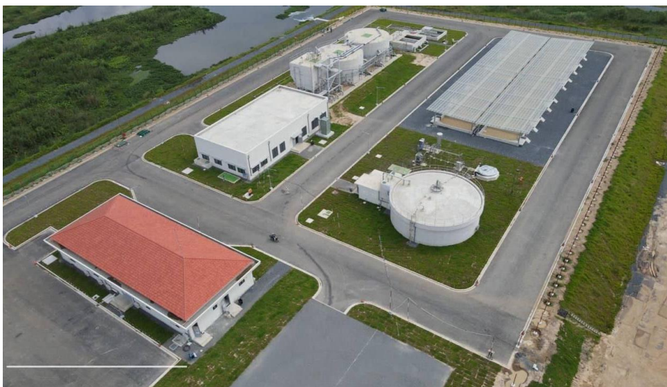
ស្ថានីយប្រព័ន្ធកម្មទឹកកខ្វក់ដើងឯក

ដើម្បីសម្រេចបាននូវកំណើនគុណភាពប្រកបដោយនិរន្តរភាពតាមរយៈការកាត់បន្ថយវិសមភាព និងការការពារបរិស្ថានផងនោះ ចែកបានចូលរួមក្នុងការគ្រប់គ្រងប្រព័ន្ធកម្មទឹកកខ្វក់ និងប្រព័ន្ធប្រឡាយលូនៅកម្ពុជាចាប់តាំងពីឆ្នាំ១៩៩៨ ដោយធ្វើការជាមួយអាជ្ញាធរមូលដ្ឋាន និងអ្នកពាក់ព័ន្ធ។ សមិទ្ធផលដ៏គួរឲ្យកត់សម្គាល់មួយគឺ ការធ្វើប្រព័ន្ធកម្មទឹកកខ្វក់ដំបូងនៅរាជធានីភ្នំពេញ កាលពីខែវិច្ឆិកា ឆ្នាំ ២០២៣។