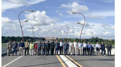
មន្ត្រីច្រករបៀងសេដ្ឋកិច្ច កម្ពុជា និងថៃ

៩០០គីឡូម៉ែត្រពីទីក្រុងហូជីមិញប្រទេសវៀតណាម កាត់តាមទីក្រុងភ្នំពេញ ប្រទេសកម្ពុជាទៅកាន់ទីក្រុងបាងកក ប្រទេសថៃ។ ស្វែងយល់ពីស្ថានភាពបច្ចុប្បន្ននៃការតភ្ជាប់ និងបញ្ហាប្រឈម ដែលត្រូវតែដោះស្រាយដើម្បីពង្រឹងវា។ ● ផ្នែកទំនាក់ទំនងសាធារណៈ