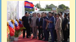
ពិធីសម្ពោធផ្លូវជាតិលេខ៥