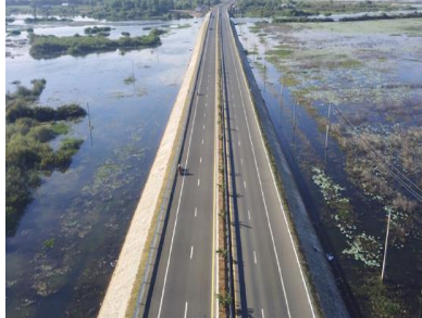
គម្រោងធ្វើឲ្យប្រសើរឡើងវិញផ្លូវជាតិលេខ៥

ពិតណាស់ប្រទេសកម្ពុជាតែងតែជួបប្រទះនឹងគ្រោះទឹកជំនន់ដោយឆ្លុះសំបែង សាលារៀន ដឹកសិកម្ម និងផ្លូវថ្នល់ត្រូវបានជនលិច។ សមិទ្ធផលមួយនេះផ្តល់អត្ថប្រយោជន៍ដល់ប្រជាពលរដ្ឋ ធ្វើដំណើរបានដោយមិនខ្វល់ខ្វាយ ពីការរាំងស្ទះក្នុងរដូវធ្លាក់ភ្លៀងខ្លាំង និងរដូវទឹកជំនន់។