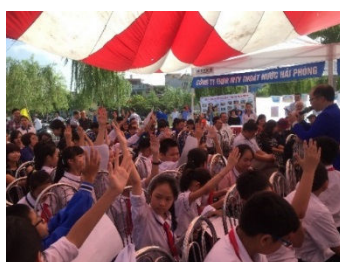
クイズ大会(イメージ)