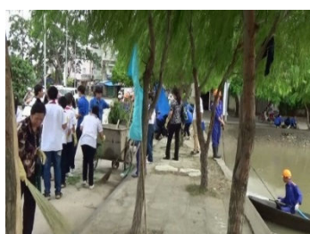
清掃活動(イメージ)