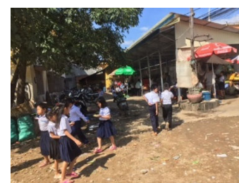
Chey chum neas 小学校