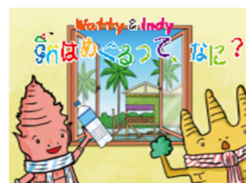
紙しばい(日本の遊び)