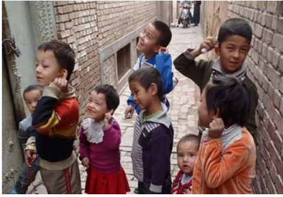
新疆维吾尔自治区接种完脊髓灰质炎疫苗的儿童。在已接种的儿童耳朵上做标记。