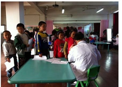
派遣医师为小学生体检，学校保健也是重要的合作项目。

仅靠政府单方面采取措施（=公助）来增进民众健康是不具有持久性的。民众自发地增强自我健康意识和改善生活习惯（=自助）以及相关团体和自愿者的协助（=共助）至关重要。事实上，如何提高服务的覆盖率是试点地区当前面临的课题，这一年来，项目工作人员业务繁重的现象也是屡见不鲜。今后，相关各方有必要在动员可能成为“共助”要素的当地企业、学校、自治会、老人俱乐部等“地区的社会资本（social capital）”的同时，考虑应该以何种形式开展“公助”，以便更好地支持“自助”和“共助”。日本政府也是在今年6月才刚刚确定了在地区保健中运用社会资本的基本方针，其推动健康城市建设还有很多路要走。期待本项目的实施可以促进中日两国间的相互学习。在发展家庭保健事业的道路上，中日合作任重而道远。家庭保健在今后中国的历史上会留下怎样的轨迹？中日合作将继续面临挑战。