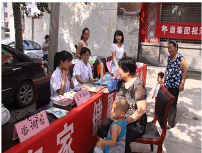
以家庭主妇为切入点，就家庭成员的健康问题提供咨询服务。

JICA和国家人口计生委开展中日技术合作项目的历史可追溯到距今30年前的1982年。在“家庭计划政策”因“独生子女政策”而为人所知的初期，中国政府通过项目实施，在全国1000多个县建立起了宣传教育网络，向总计约6亿民众传达了计划生育的重要性。随后，JICA顺应国家人口计生委的发展需求，与其合作开展了扶贫对策、农村保健、生殖健康领域的相关项目，为加强中国计划生育部门行政体制的建设和人才培养做出了贡献。目前正在实施的项目响应中国政府在人口政策中提出的“从量向质转变”的号召，贯彻“家庭保健”这一主题思想，参考日本在“地区保健”方面的经验，以可称之为“家庭健康守护神”的主妇为切入点，为儿童和老人等家庭成员提供有助于增强其健康的服务。