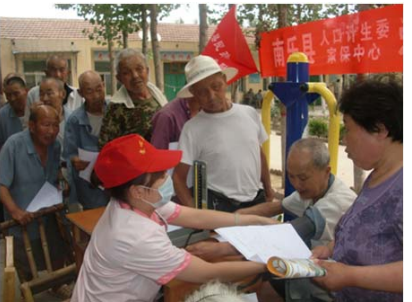
面向中老年人的体检，还有很多人是第一次测量血压。

本项目通过“健康教育”、“健康检查”、“健康咨询”3种服务，为中国政府在家庭保健服务的模式构建、政策化以及普及方面提供了支持。家庭保健的对象涉及广泛，包括传染病、生活习惯病、母子保健等，但不论对象如何，其最终目的都是根据各地区的实际需求，提供民众所希望的服务。通过本项目，反复进行了根据“地区诊断”结果制定计划的训练，各项服务也从今年开始正式在试点地区推广执行。在本次交流会上，相关负责人就在各地区花大力气开展“免费体检服务”、“亲子健康班”、“家访独居老人”等各项工作的情况向与会人员进行了汇报。本项目的深入开展正在对中国社会产生巨大的影响，人口和计划生育事业发展“十二五”规划以及各省、地区的政策已经将各项家庭保健服务的措施工作提上了日程。