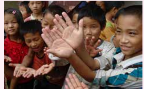
云南省少数民族地区小学校改善健康、卫生环境项目