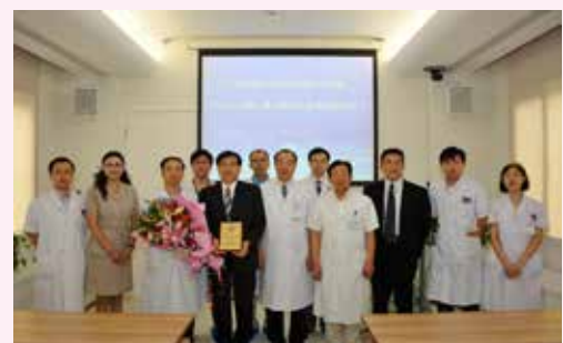
国土教授（左五）获得名誉教授称号

医疗同学会邀请在日本享有盛誉的东京大学和大阪医科大学小儿科、肝胆胰外科、肠胃外科、呼吸道外科、消化外科的9名专家到访中国，他们在研究治疗方面积累了丰富的经验，享有极高威望。通过与中日两国专家进行的一系列学术交流、信息共享、经验分享，部分日本专家还结合演讲内容进行了手