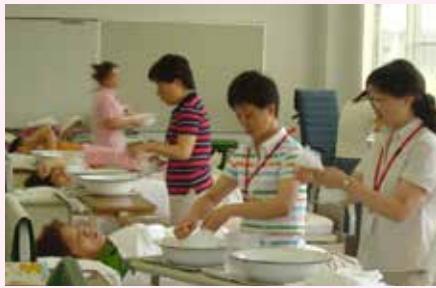
江西省老年介护师培训项目

2012年12月至2013年3月，开展对中国基层友好技术合作项目的事后调查评估，总结各项目的实际实施效果与影响效果的内外因素，为今后形成更多优质项目、保证各项目顺利实施奠定基础，同时为该事业在中国的发展探索新的方向。