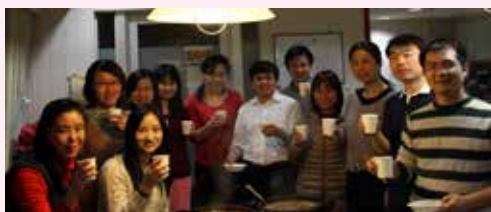
国际大学同学在日本欢度蛇年除夕

今年是JDS项目在华启动10周年。10年间送出近400名留学生。留学生回国后积极发挥着桥梁作用，与支持基础设施建设或者提供硬件设备的合作有所不同，人员交流更能成为永久的财富。