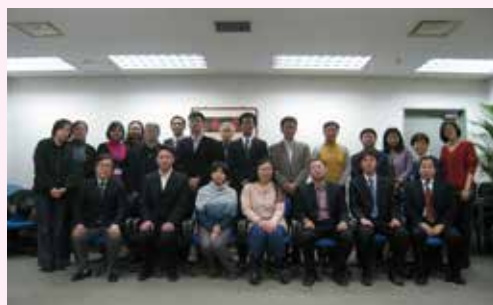
参会人员合影留念

目前在中国,JICA归国长期进修生共达100名,他们活跃在各个领域,有望成为该领域的高级专业人才。期待他们不仅为中国的国家建设做出贡献,还能为构筑中日两国友好桥梁献出一份力量。