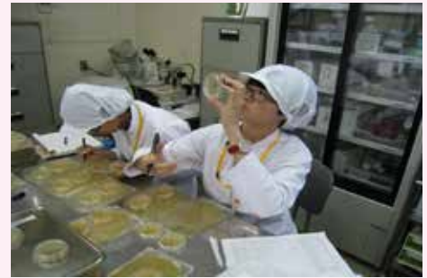
实验室学习过程剪影

在日本，宫颈癌在20-30岁的年轻女性中呈上升趋势，每年约有7000人罹患宫颈癌，其中约2500例死亡。日本学者曾对18644例无携带HPV的15-25岁的女性开展双盲临床试验，认为Cervarix二价疫苗（葛兰素史克生产）能够防止因HPV16、HPV18导致的宫颈上皮内瘤样变，疫苗效能高达98.4%，疫苗的保护年限至少为6.4年，高浓度的抗体滴度可持续至少20年。2009年10月16日HPV在日本上市，推荐11-14岁女性是最佳接种年龄，但若不在最佳接种年龄内，15-45岁女性均可接种，共三剂次分别于第0、1、6月采用肌内注射。目前我国港澳台地区已获批准使用该疫苗，大陆也在积极开展临床试验，相信不久的将来将会问世。