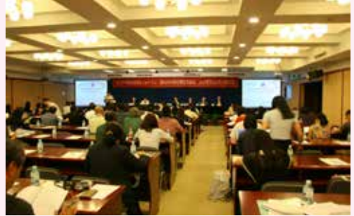
中日韩NGO代表汇聚一堂

8月22日~23日，中国国际民间组织合作促进会（中国·CANGO）、志愿者活动国际研修会（日本·JIVRI）、韩国志愿服务论坛（韩国·KVF）共同在北京主办了“2012第三届中日韩公民社会论坛”，JICA作为主办方之一参与了论坛的举办。来自各国的NGO和NPO代表以及政府机构的代表、学者、企业相关人员等120多人聚集一堂，共享了东亚公民社会、NGO活动现状等信息，进行了广泛的交流。