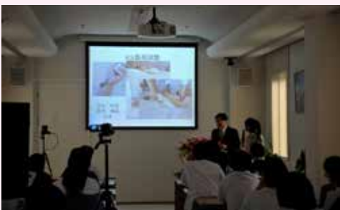
国土教授讲座（右二）

为纪念中日邦交正常化40周年，2012年6月至12月，JICA医疗领域归国进修生同学会前后五次与中日友好医院、JICA联合在京举办了国际学术研讨会。