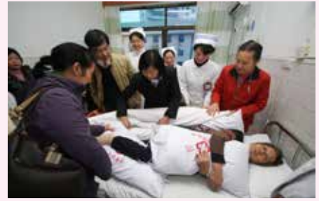
上海高龄者护理教员培训项目