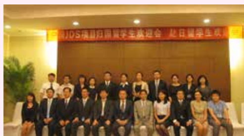
8月2日第一批留学生欢送会

35名留学生将在11所大学（筑波大学、立命馆亚洲太平洋大学、广岛大学、名古屋大学、九州大学、国际大学、一桥大学、庆应大学、早稻田大学、京都大学、政策研究大学院大学）的研究生院攻读法律、公共政策、经营、经济和国际关系专业。