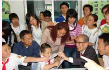
关于如何营造及开展智障儿童教学环境项目

在每个项目结束前，日方都会通过定期评估考察、结束时评估等手段确认项目的实施效果，评估结果也会通过公开的报告会等形式公布。但另一方面，在中国国内还存在着对该项目的理解并不充分，相关信息的透明度不高等问题。我们将在