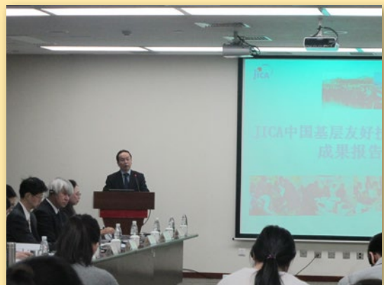
JICA 中国事务所小中铁雄所长致辞

2014年3月4日，JICA中国事务所在北京召开中国基层友好技术合作项目成果报告会，对2000年到2012年在中国开展的基层友好技术合作项目进行了总结评价。日本大使馆、科技部中日科技合作事务中心、日本自治体国际化协会北京事务所、新潟市产业振兴财团北京代表处、冲绳县产业振兴公社北京代表处以及中日企业、大学、公益团体、JICA技术合作项目专家等70余名各方人士出席了会议。