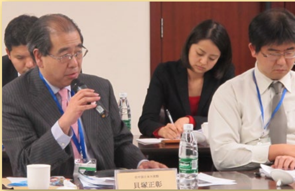
日本大使馆贝塚公使发言