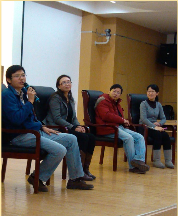
分论坛上 JICA 等资方组织代表与参会者互动

年会已举办八届，为环保NGO搭建了交流与沟通的平台，促进了环保民间组织可持续发展，为凝聚社会力量参与支持、关爱生态环境贡献了力量，发挥了政府助手补充的作用，实现了环保NGO组织作为社会第三方力量的支撑作用。