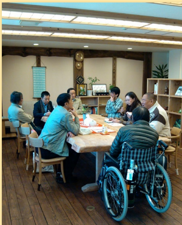
参会者参观访问贫困者支援组织 - 故乡之会

同时，为配合第四届东亚公民社会论坛的召开，11月20日~29日，JICA在东京举办了在中国开展的基层友好技术合作项目图片展。从2000年起，JICA在中国共实施了179个基层友好技术合作项目。通过实施这些项目，支援了中日两国NGO、大学、地方政府以及社会公益团体联合开展的事业，并在应对老龄化社会，帮扶社会弱势群体、残障人士、防止沙漠化、保护环境、医疗保健、提高居民生活水平等各个领域，开展了为数众多的合作项目，这些项目为解决中日两国共同面对的问题发挥了积极作用，对中日双方的执行单位来说意义深远。通过展示合作现场的图片，使参观者有了身临其境之感，对加深大家对项目的理解起到了积极的作用。