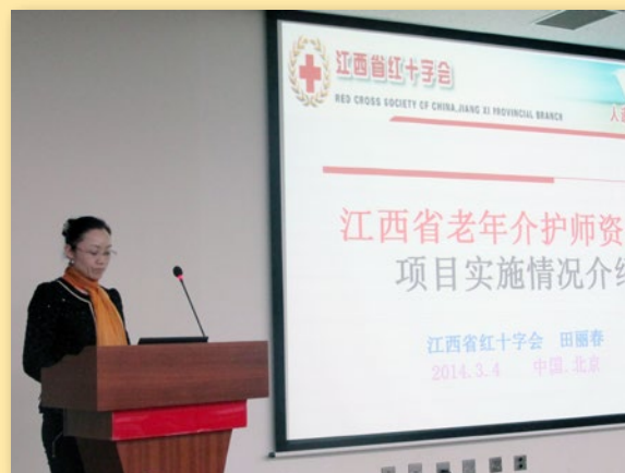
江西省红十字会培训中心田主任介绍项目执行情况