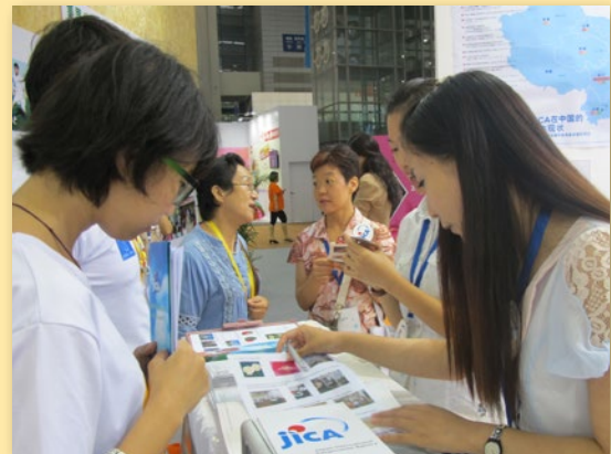
在展台前向参会者介绍 JICA 在中国开展的工作

据主办方统计，3天的展会共吸引了14万人次到场参观，现场签约对接的重大项目有50个，签约金额逾17.08亿元。此外，展会还举办了12场学术研讨会，50场公益沙龙，36场体验活动，发出了中国公益最前沿的声音。慈展会凝聚了全国公益慈善事业方方面面人士，大家在慈展会上得以亲密接触，慈展会已然成为中国慈善大家庭的年度团圆聚会。