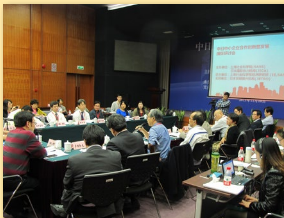
参会中日专家展开热烈讨论