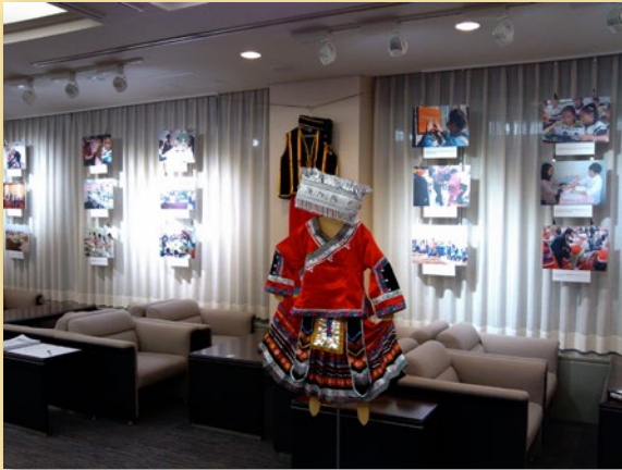
中国基层友好技术合作项目摄影作品展