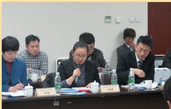
会上科技部代表发言

会议的上半部分由两个报告组成，首先，三菱综合研究所发表了对在中国开展的地方建议型项目所做的调研，重点对直接或间接参与该项目的地方自治体、企业带来的成果进行了统计和分析。接下来，明善道（北京）管理顾问有限公司发表了调查结果。该咨询公司日前受JICA委托，就已结束的基层友好技