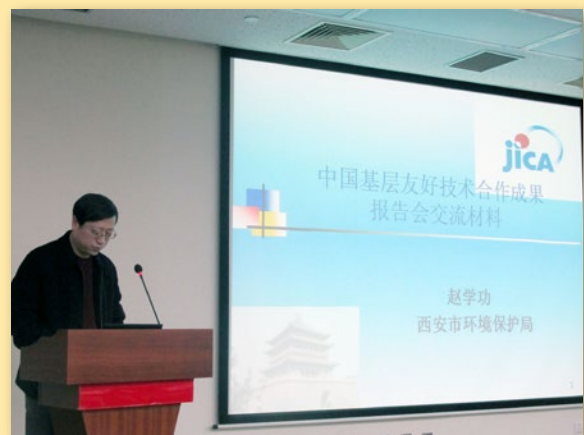
西安市环保局代表介绍项目执行情况