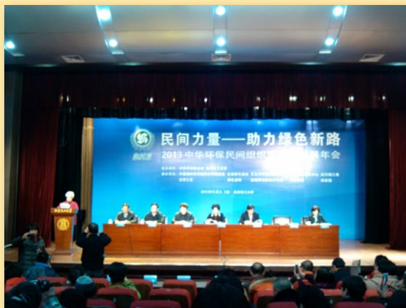
著名表演艺术家、中华环保联合会常务理事田华宣读年会倡议书

年会上发布了《2013环保NGO工作报告》，总结了环保民间组织在保护生态环境方面的基本经验与做法，研究了行业的创新与发展。