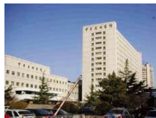
蓝天映衬下的中日友好医院

所谓技术合作，就是为培养推动发展中国家的国家建设所必需的人才而进行的援助。也就是接收来自发展中国家的进修生到日本，或者从日本派遣专家、青年海外协力队员等进行的援助合作。