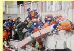
日本国际紧急援助队救援小组的救援场面

2008年5月四川发生大地震后，作为国外的第一支救援队日本国际紧急救援队抵达中国，并展开相关救援工作。另外，日本政府又继续向受灾群众进行了紧急物资援助，派遣医疗队，追加物资供给等一系列救援工作。在2011年3月东日本大地震发生后，JICA项目的中方实施机构中国地震局组成了中国紧急救援队派遣到日本。日常的合作所建立的关系为互相帮助打下了基础，这可以说是一个好的实例。