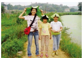
在湖南省开展工作的青年海外协力队员（幼儿园教师）

随着中国的经济发展，对华经济合作内容也发生了变化，现在重点支持解决环境污染、传染病等问题以及增进日中两国人民相互理解领域的项目。