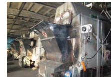
北京综合环境治理项目（项目实施前）