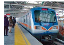
北京城市铁路建设项目（地铁13号线）