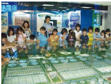
在北京市高碑店参加课外活动的北京市日本学校的师生们

据2006年5月19日China Daily的报道，国际奥委会（IOC）也参观了该污水处理厂，该厂为成功申办奥运做出了贡献。