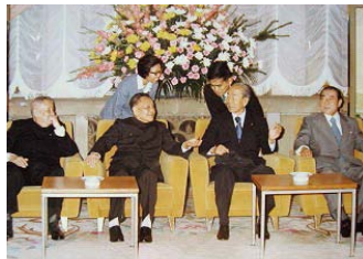
1978年福田首相（当时）会见到访的邓小平副总理（当时）。1979年日本开始对华经济合作

“世界各国都认为应当祝福贵国（中国）的现代化政策，这完全是因为这一政策直接关系到国际协调的核心问题，并且更加富强的中国的出现可望使世界更加美好；我国之所以大力推行对中国的现代化进行合作的方针，不仅有我国自己的考虑，而且也是由于有这种全世界的期待在做后盾。”