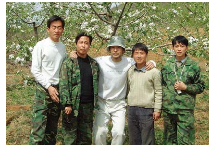
进行农业指导的青年海外协力队员

目前，派遣的志愿者半数以上为日语教师。来到中国的日本志愿者们与当地人民共同生活，为民间交流的发展做出了贡献，促进了两国之间的相互理解。