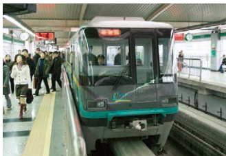
重庆轻轨铁路建设项目

在这些项目中，有很多诸如北京首都国际机场、北京地铁（1号线、13号线）、北京给排水项目（第九供水厂、高碑店污水处理厂）、上海浦东国际机场、重庆轻轨、武汉长江第二大桥等与百姓生活密切相关的日元贷款项目。另外，通过无偿资金援助与技术合作实施了一批以北京中日友好医院为代表的直接关系到提高中国人民生活水平的項目。