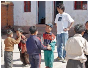
在四川省凉山州工作的青年海外协力队员（日语教师）

实行改革开放政策的中国的进一步稳定与发展，日中两国友好合作关系的加强，对于亚洲、太平洋地区乃至全世界的稳定与发展都是极其重要的。