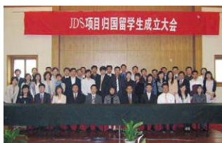
JDS同学会成立大会时的情形

在建设位于北京的康复研究中心以及医疗设备配备等方面进行合作，为其提供了无偿资金援助。并且，通过专家派遣、接收研修生等技术合作确立了在中国导入理疗师、作业疗法师的基础。该中心是北京残奥会的指定医院，并正以残奥会为契机开展日中残疾人交流等各种合作。