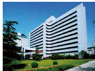
中日友好环境保护中心

自1981年以来的10年间，日本政府为该医院提供技术合作，派遣大批专家，向在日的中国医生、护士提供培训等，为中日友好医院在医疗、教育水平、医院管理技术等方面的提高做出了巨大的贡献。1999年该医院入选中国政府选定的“100家优秀医院”，并发展成为中国具有代表性的医院。在北京奥运会期间，该医院还被北京奥组委指定为奥运定点医院。