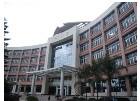
项目建设的桂林医学院图书馆