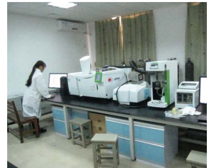
本事業で購入した機材を使用している様子 (華東交通大学)