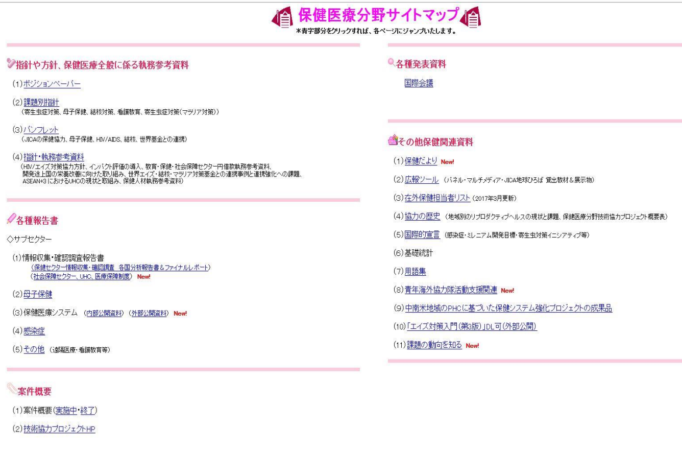
図1 JICA Knowledge Site 保健医療分野のサイトマップ