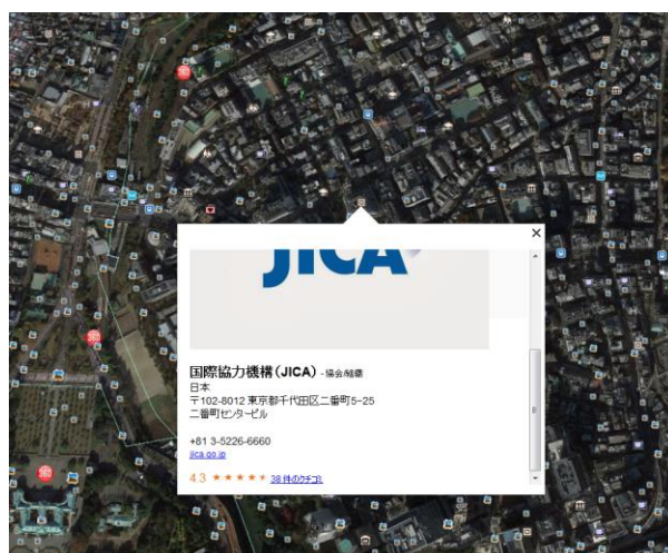
図3 プロジェクト情報