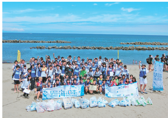
学校近くの海岸を清掃し、プラスチックゴミについての実情を体感

エッセイコンテストを通して、生徒たちは世界で起きている諸課題が自分たちの行動と密接に関係していることに気づき、「生き方」を考える生徒が増えたように感じています。『「世界」と「わたし』』という意識が芽生え、例えば看護師を目指すある生徒は、「国際医療」に関心が向き、将来の職業に関連する課題を掘り下げて考えるようになりました。このように、気持ちや考えを「文字化」することで、自分たちがおこなった活動に対して客観視することができ、「やらされる活動」が「自ら進んでおこなう活動」に変化してきたと感じています。