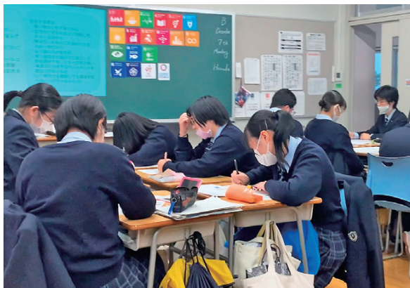
「SDGsって？」初めて聞く生徒もそうでない生徒もみんなで考えた「持続可能性」