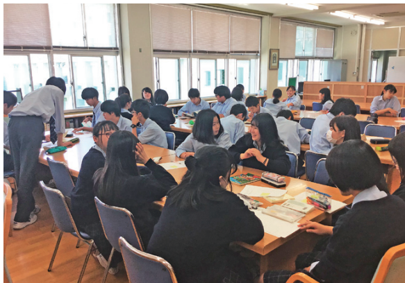
新潟県についての地域探究。グループでの話し合いが活発でした。

・当初は自分たち高校生ができることは、「募金しかない」と考えていた生徒たちだが、様々な活動を通して、高校生でもできることがあることを実感している。