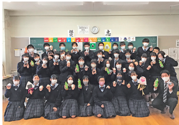
募金以外にも私たちにできることがあった。おにぎりを食べて国際貢献