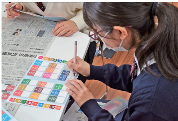
記事に該当すると思うSDGs付箋にコメントを記入