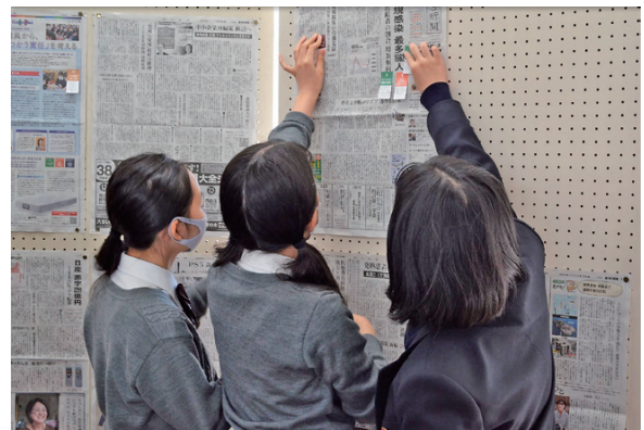
コメントを書いたSDGs付箋を新聞記事に貼りに行く様子