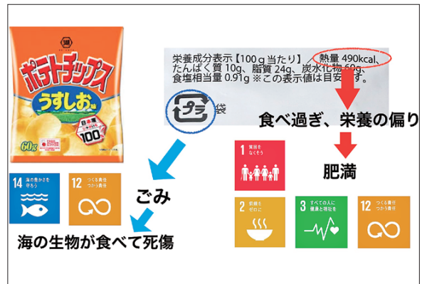
オンラインで行った「身近なものからSDGs連想ゲーム」の進め方例