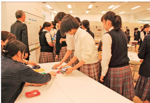
SDGsカードゲームでプロジェクトを実行している様子

エッセイコンテストへの応募をきっかけに、生徒たちは地域社会や世界と自分とのつながりをより具体的に考え、行動の幅を広げており、国際協力に対する積極性を増しているように感じます。