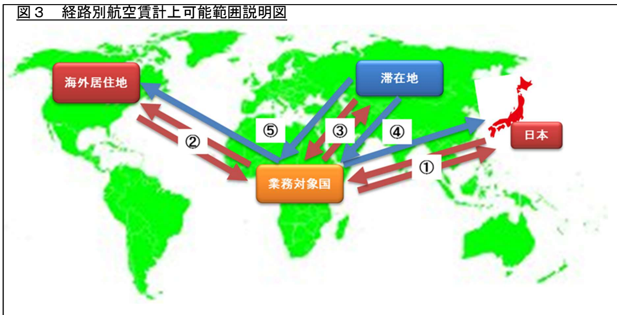
図3 経路別航空賃計上可能範囲説明図