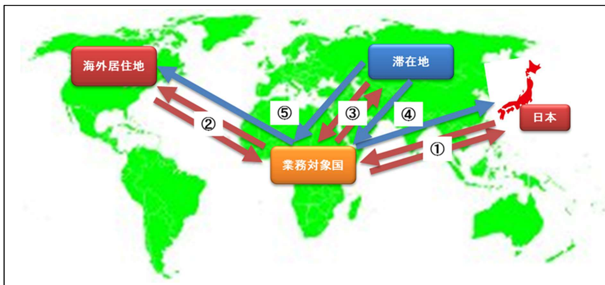
図3 経路別航空賃計上可能範囲説明図

b) 出発地と帰着地とが異なる場合（上記ケース④⑤を除く。）は、原則として往路（出発地→業務地）のみ計上を認め、復路（業務地→帰着地）の計上は認めません。