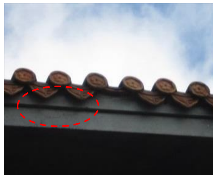
女役瓦の破損部分の状況