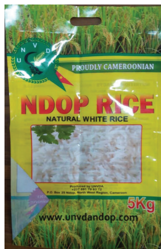
UNVDA 国産米現行パッケージ 2表