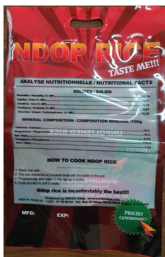
UNVDA 国産米現行パッケージ 1裏