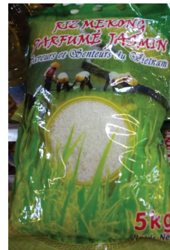
輸入 ベトナム米 CASINO 表