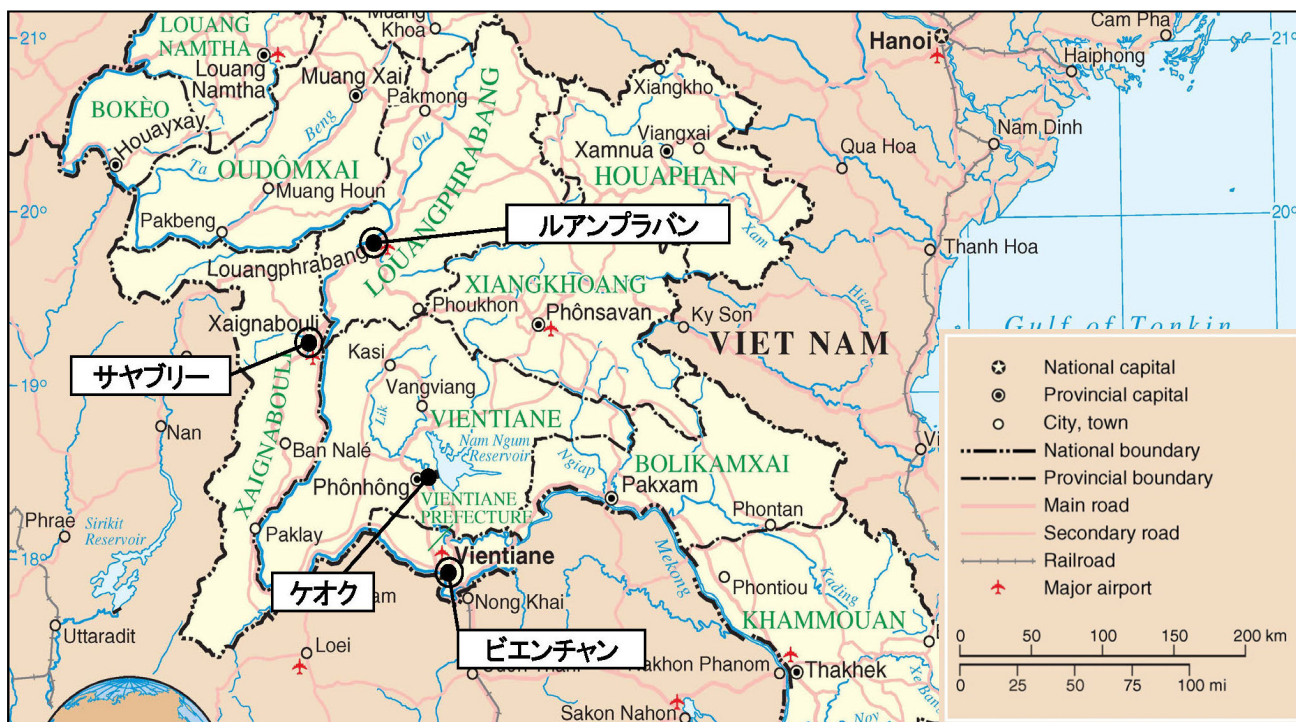
ラオス現地研修の訪問先主要都市

※ 地図出典: UN(国際連合)ウェブサイト内 http://www.un.org/Depts/Cartographic/map/profile/laos.pdf