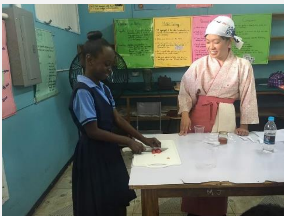
姿勢や包丁の持ち方などに気をつけてミニトマトを切る生徒。 トマトジュースを作っている

私の配属先である4-Hクラブは農業系の青少年育成団体で、子どもたちにリサイクル工作や学校菜園作りなどさまざまなトレーニングを行っている。私の担当は家政分野だ。