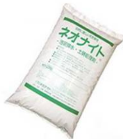
浄化剤ネオナイト