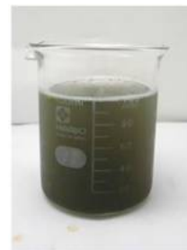
ペルー国内の工業排水