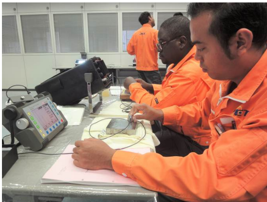
超音波探傷試験の実習風景

※時間や予定が変更になる場合もございますので、取材をご検討いただける際には、事前に下記連絡先までご一報いただければ幸いです。