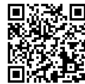
JICA海外協力隊 活動分野/職種

体験談を通じて、異文化理解、SDGs、国際協力、キャリア教育などについても学習できます。