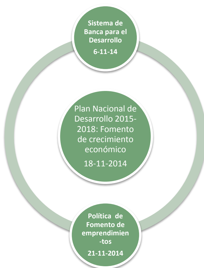
Figura 1. Ejes de política en materia PYMEs de la Administración Solís Rivera 2014-2018

crecimiento económico y mercado interno. Para lograr la consecución de este objetivo se utilizarán dos instrumentos de política: el Sistema de Banca para el Desarrollo (SBD) y la Política de Fomento de Emprendimientos.