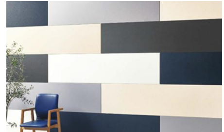
ニチハ社製窯業系外壁材の例

JICAの協力のもと、ウクライナでの事業展開を目指す愛知県のニチハ株式会社は1月23日、エストニア国タリン市にて、エストニアの援助機関と関連企業を招き、窯業系外壁材の導入に関する施工セミナーを実施します。同社製品はウクライナの環境に適した性能を持ち、短工期を実現できるのが特徴で、同国の迅速な復旧・復興への貢献を目指しています。