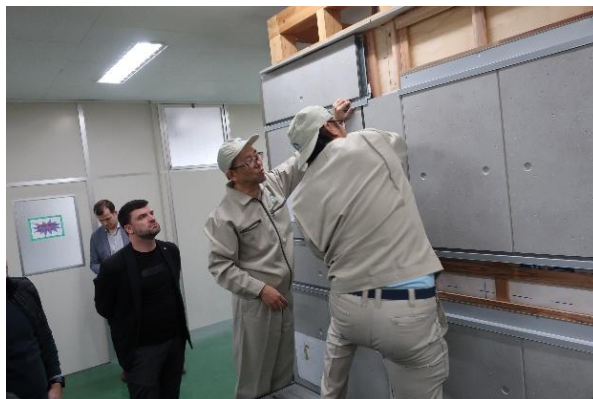
昨年愛知県で実施した施工セミナーの様子