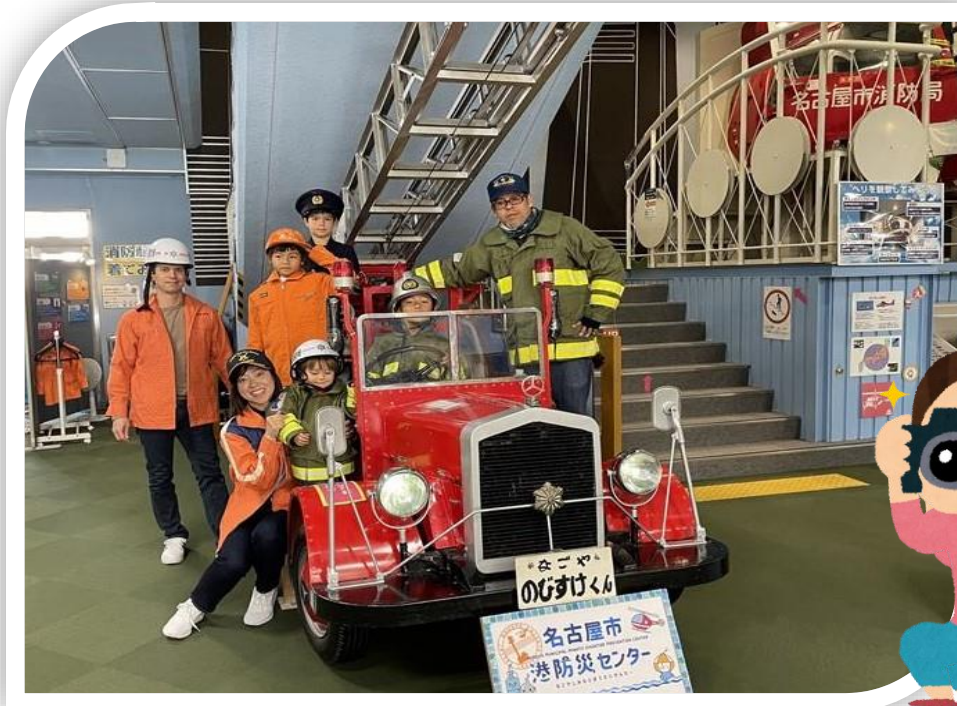
↑ しょうぼうふく きて しゃしん