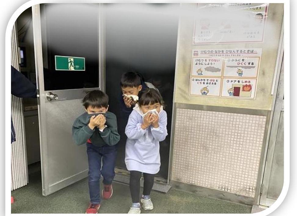
↑ かじ の けむり から にげる !